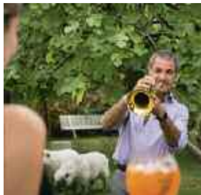
Jazz Musique à l'hôtel de Silhouette.

Plage de Marbella, Biarritz. 06-27-78-13-12.