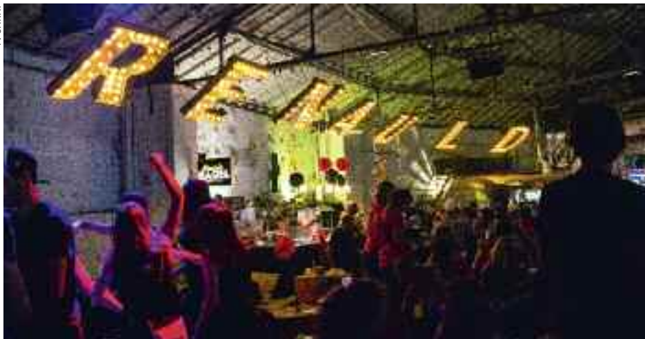
Concept Soirées animées dans un ancien garage devenu un bar géant.