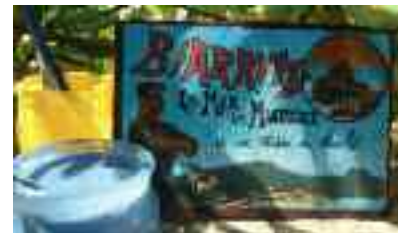
Chaud Tout sur l'histoire du chocolat.

Découverte de l'univers du cacao, dégustation et réalisation de sujets. 14, avenue Beaurivage. Biarritz. 05-59-23-27-72. Planetemuseeduchocolat.com