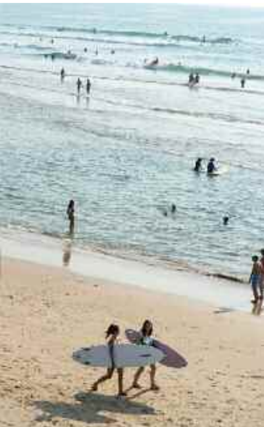
La planche, l'autre amie de vos vacances.