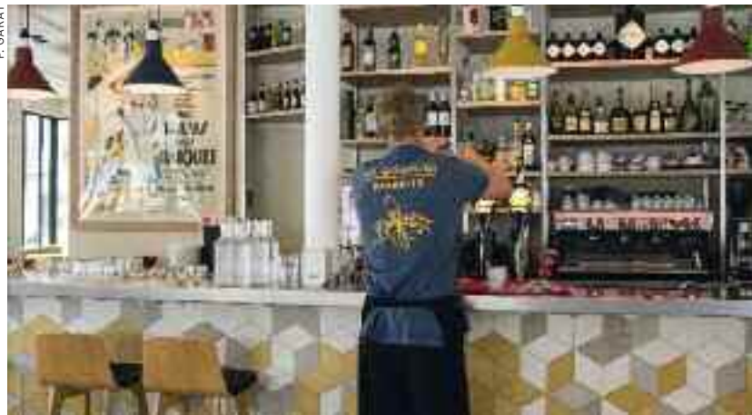
La Coupole La célèbre brasserie s'est réveillée !