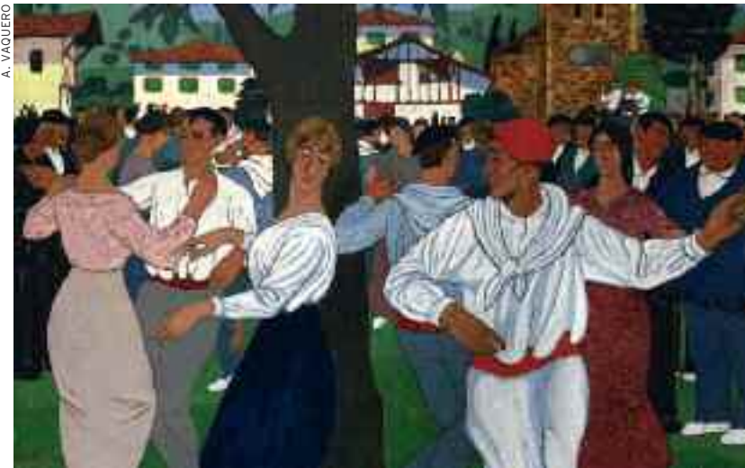
Tradition Fête au village, une toile de Ramiro Arrue, peintre basque.