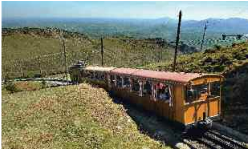
Immanquable Le petit train à crémaillère de 1924 gravit les flancs de la Rhune.