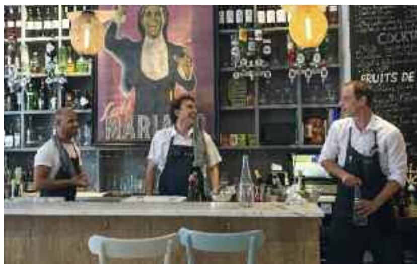
Chistera et coquillages Dans une ambiance biarrote, on se régale de tapas.