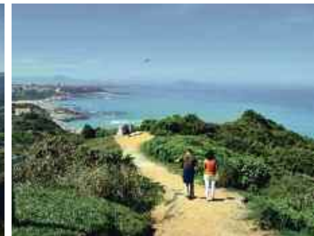
Evasion Sur les côtes d'Irouléguy ou le long du littoral, les panoramas magnifiques sont à la hauteur des efforts consentis.