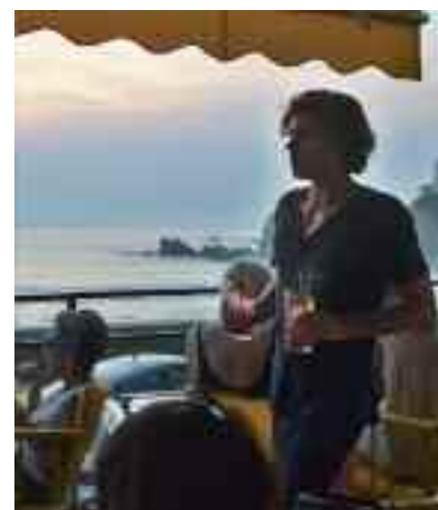
Le Carlos , un coin de Californie à Biarritz.

♦ L'Hétéroclito, sentier des Baleines, Guéthary. 05-59-54-98-92.