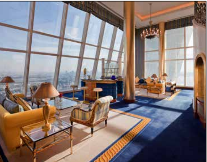
Athens Royal Olympi Hotel 5* Bar & Lounge