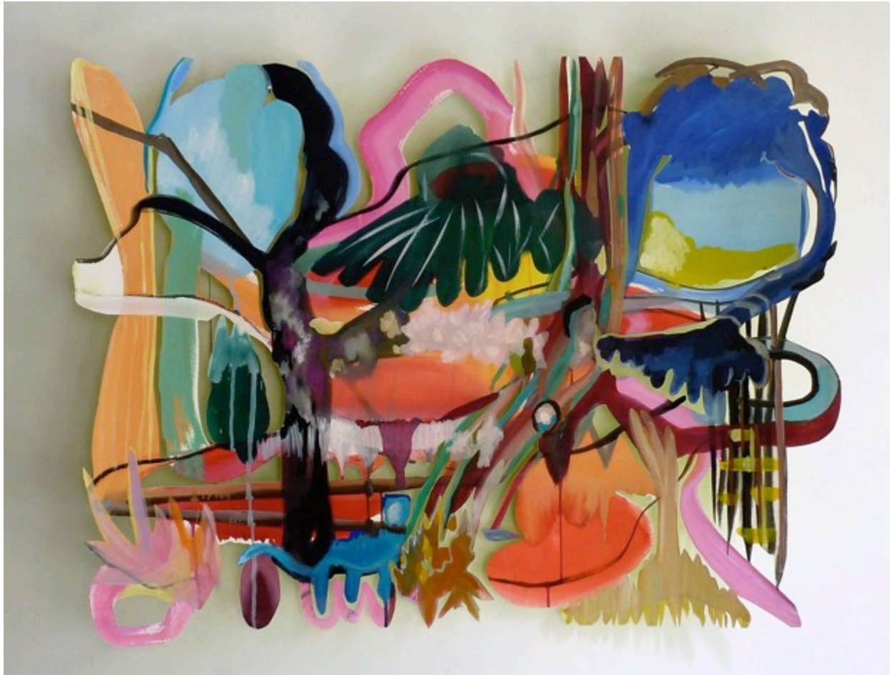
Juliette Jouannais, Sans Titre, gouache recto-verso sur papier découpé,