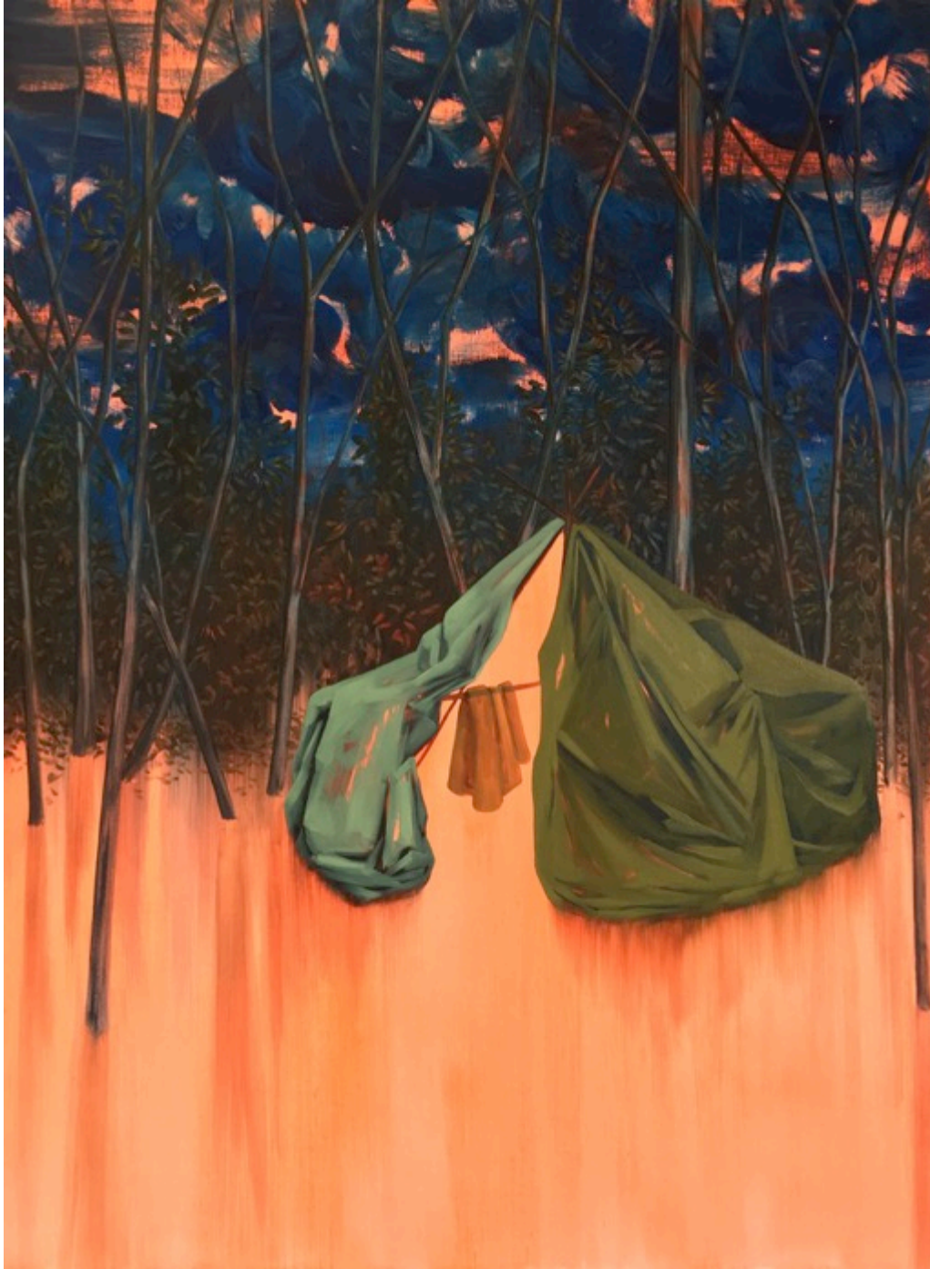
Emilie Bazus, Anonyme XII, mixte sur toile, 130x97 cm