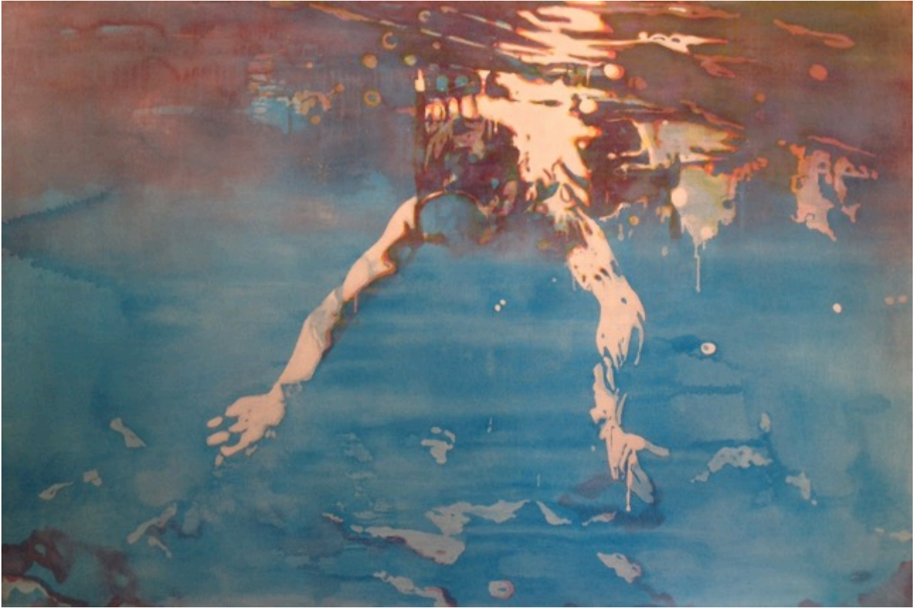
Gil Bourget, Le plongeur, mixte sur toile, 97x146 cm