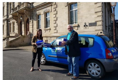
Dans l'Oise, Remise de masques FFP2 à la Ville de Creil

Dans l'Oise, un collectif d'agents a produit plus de 400 visières de protection sur imprimante 3D pour le monde médical.