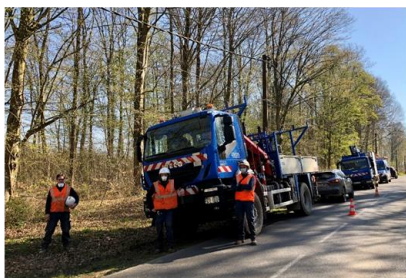
Dans l'Aisne, Dépannage en forêt de Retz

Un mix d'opérations sur le terrain et de pilotage à distance des 30.000km de réseaux picards et 5.000 interventions à la clé en 2 mois.