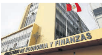
En el 2017 el MEF espera atraer $1500 mlls.

El ministro Thorne recordó que la Sunat perdonará las deudas que las Mypes hayan judicializado por menos de una UIT.