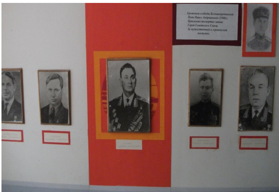
Герои Советского Союза - наши земляки