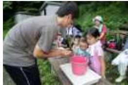
実物を手によ〜く観察！