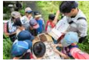
集めた抜け殻を種類ごとに分けました