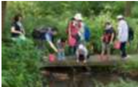
ザリガニを釣って・・・

◇お話しもザリガニを見ながらだったので、とても分かり易かったです。外来種についてのお話しも良かったです。