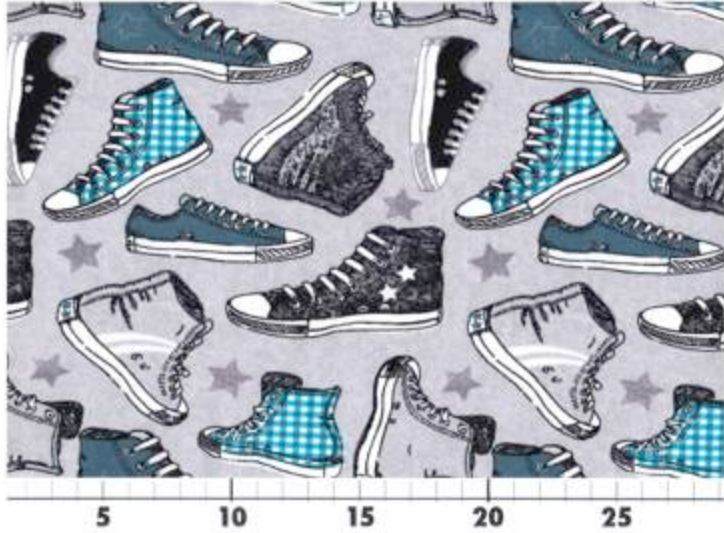
95% Baumwolle / 5% Elasthan