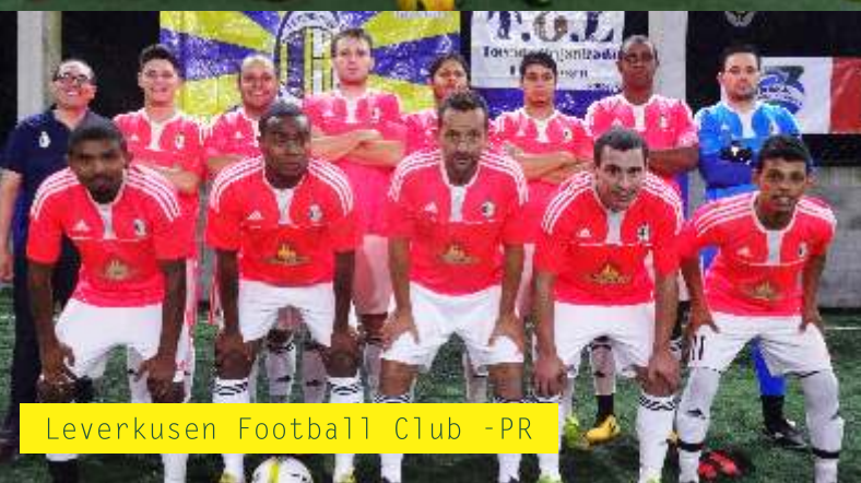
Leverkusen Football Club - PR