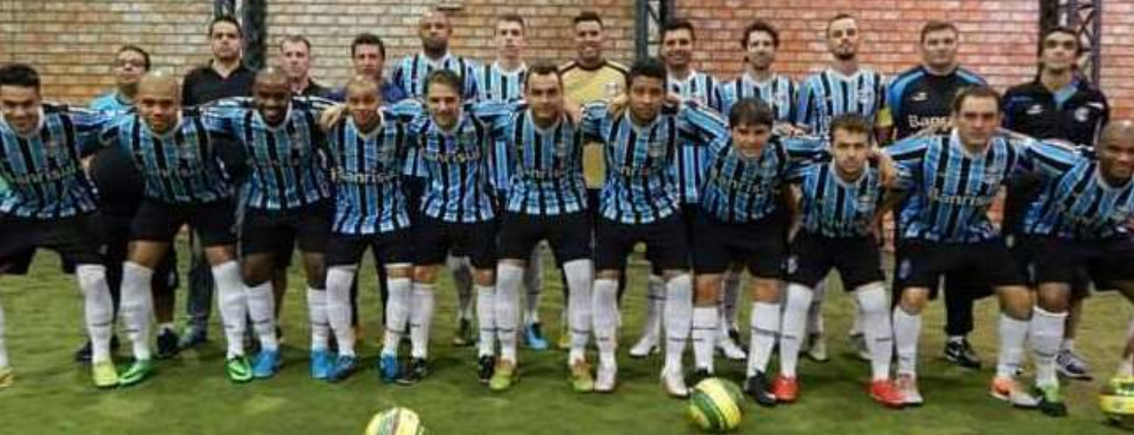
Grupo de futebol Atlético Carioca - RJ