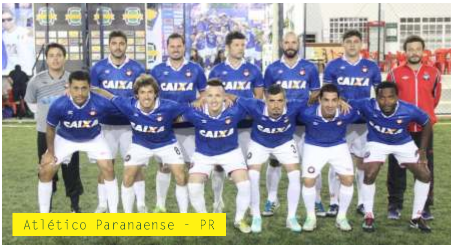
Atlético Paranaense - PR

Qualquer equipe interessada poderá participar da Copa da Liga e as equipes poderão inscrever no máximo 20 (vinte) atletas para a disputa. Para ser campeão cada time realizará um número máximo de 09 (nove) partidas. As cidades sedes estão distribuídas nos 26 estados brasileiros além do Distrito Federal.