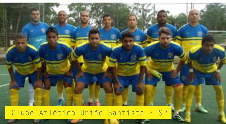
Clube Atlético União Santista - SP

As equipes vencedoras das competições municipais poderão se inscrever na LIGA DOS CAMPEÕES, campeonato que será realizado entre os dias 21 e 24 de abril de 2016 em Curitiba-PR. O campeão da Liga dos Campeões participará da LIGA FUT 7 (2016), a liga profissional do Futebol 7 brasileiro junto com os grandes clubes do país, transmissão ao vivo para todo o Brasil e com todas as despesas pagas (transporte, hotel e alimentação).