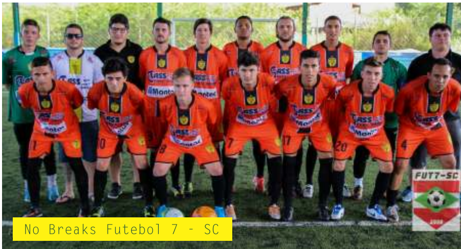
No Breaks Futebol 7 - SC