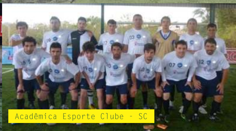
Acadêmica Esporte Clube - SC