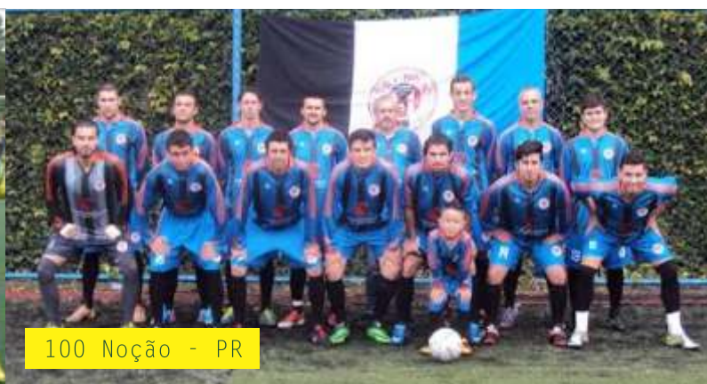
100 Noção - PR