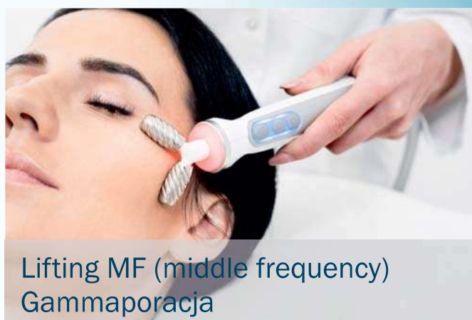
Lifting MF (middle frequency) Gammaporacja

Hydroimpact Plus reprezentuje nową dziedzinę medycyny anti-aging - terapię wodorową. Aktywny wodór neutralizuje wolne rodniki tlenowe odpowiedzialne za starzenie skóry. Głębokie oczyszczenie oraz eksfoliacja naskórka daje efekt odświeżenia i wyrównuje koloryt skóry. Rezultat zabiegu dopełnia wprowadzenie składników odżywczych za pomocą gammaporacji oraz lifting MF - innowacyjne rozwiązanie do poprawy napięcia i gęstości skóry.