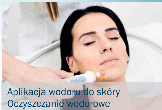
Aplikacja wodoru do skóry Oczyszczanie wodorowe