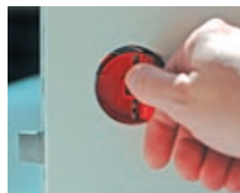
Den röda varianten av Handlx är avsedd för normala innerdörrar.

finns i två modeller: Det svarta, som passar i tjockare dörrar med en tyngre låskista, samt det röda som är anpassat för normala innerdörrar. Den röda modellen sitter färdigmonterad i låset redan när dörrarna sätts på plats på byggarbetsplatsen med den svarta modellen får monteras på byggarbetsplatsen. Då följer vredet och monteringsanvisningar med dörrarna. Samtliga på bygget kan märka de positiva effekterna: