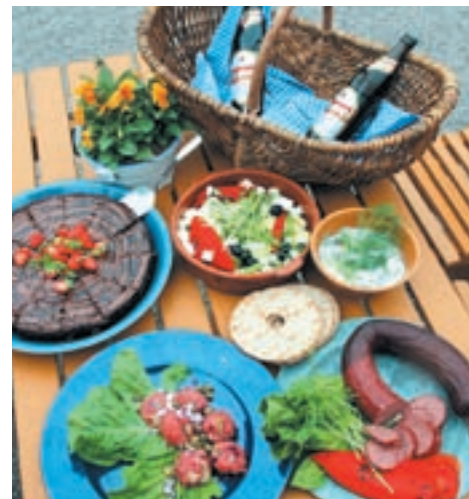
Exempel på en välfylld picknickkorg

Låt paprikan rinna av. Koka potatisen, skär den om nödvändigt i mindre bitar. Skär varje paprika-halva i en centimeter breda avlånga strimmor.