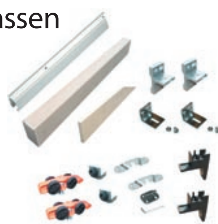
Material som hör till ett av skjutdörrsbeslagen från Svalk.

Svalk är ett danskt företag med 25 anställda, som ligger vid Mårslet, strax söder om Århus. De har funnits i 30 år, varav de senaste tio åren även i Sverige.