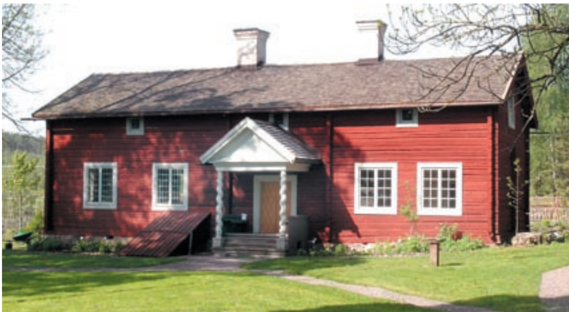
Linnés bröllopsstuga vid Sveden utanför Falun är ett utflyktsmål i sommar som ligger i tiden, med anledning av hans 300-årsdag. Här gifte sig Carl von Linné 1739.