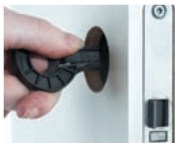
Den svarta modellen av Handlx passar i tjockare dörrar.

Plastvredet Handlx löser alla dessa problem. Detta plastvred