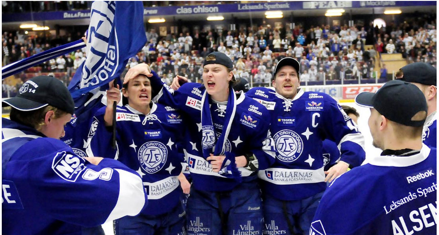
Glädje i Leksand i samband med avancemanget till elitserien. Mycket talar för att vi kan få uppleva liknande glädje i vinter.

Läs mer om Göthes på vår hemsida: www.gothes.se