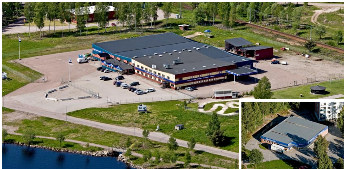
De två fastigheterna som fortfarande ägs av Göthes, Göthes AB i Falun och Gästrikre Lås AB i Sandviken.

Beslag har stängt veckorna 28, 29 och 30. Säkerhet och Teknik har öppet hela sommaren. Beslagsjour, tel: 023-480 19 Säkerhet, tel: 023-480 19. Teknik, tel: 023-480 25 Jourfax, samtliga avdelningar: 023-480 20.