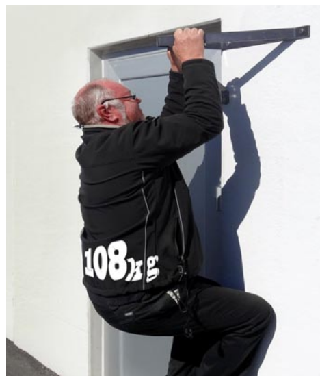
Dörrstopp vägg tål hårda tag och klarar minst 108 kilo.