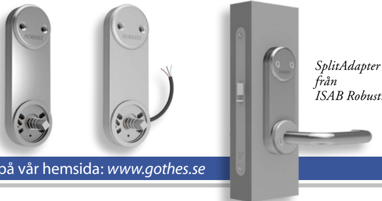
SplitAdapter från ISAB Robust.

Läs mer om Team Göthes på vår hemsida: www.gothes.se