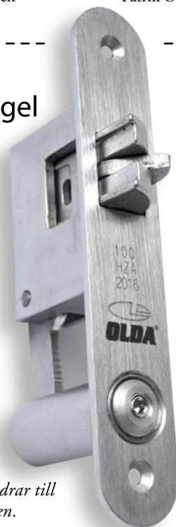
OLDA 100 HZA bidrar till att klara brandkraven.