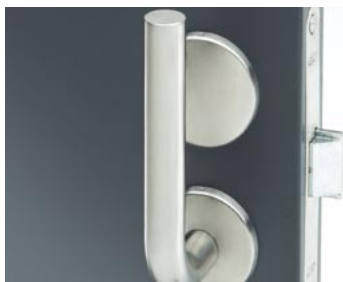
WC-trycket Abloy 2025 med nygamla låsmetoden

Dörren låses genom att personen lyfter handtaget uppåt på