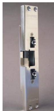
Motor-slutblecket Exma Rapid har fått ett positivt mottagande på marknaden.

2005 kom Exma Rapid ut på marknaden och Håkan Nordvall berättar att motorslutblecket snabbt fick ett positivt mottagande på marknaden.