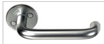
Assas handtag 6616 med ytbehandling Addion.

Bakgrunden är att bakterier ofta sprids via händer och de