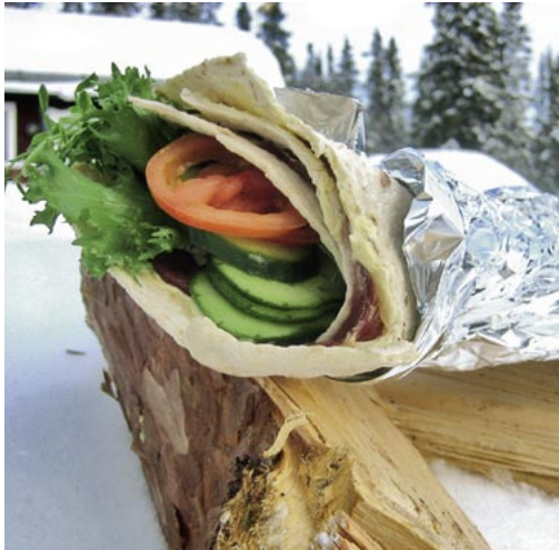
Visst ser Lövåsrollen god ut.