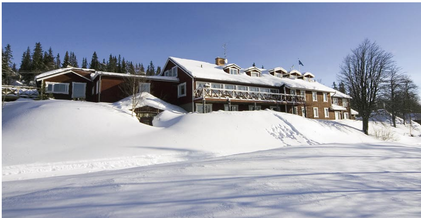
Lövåsgårdens Fjällhotell ligger vackert inbäddat i djup snö vid Grövelsjön.