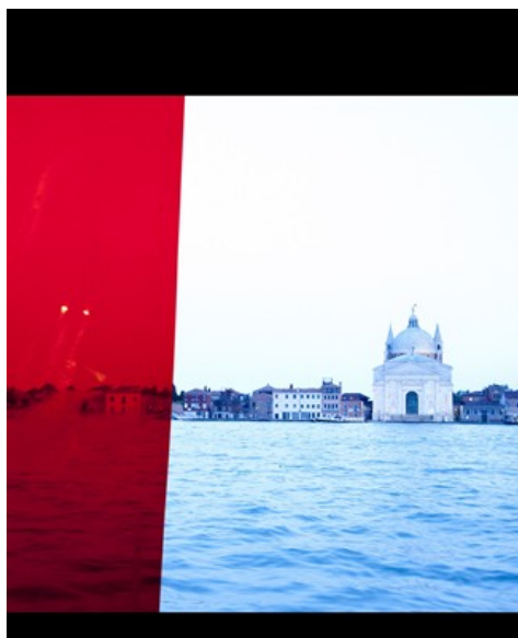
Un dettaglio della foto di Ugo Carmeni: Chiesa del Redentore, Venezia.

Ugo Carmeni , laureato in architettura, si occupa di fotografia attraverso la quale studia le percezioni visive e la descrizione dello spazio