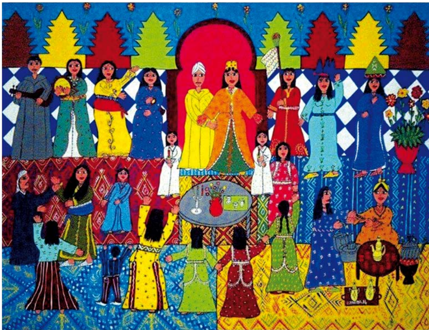
Sans titre : Acrylique sur toile 110 cm x 90