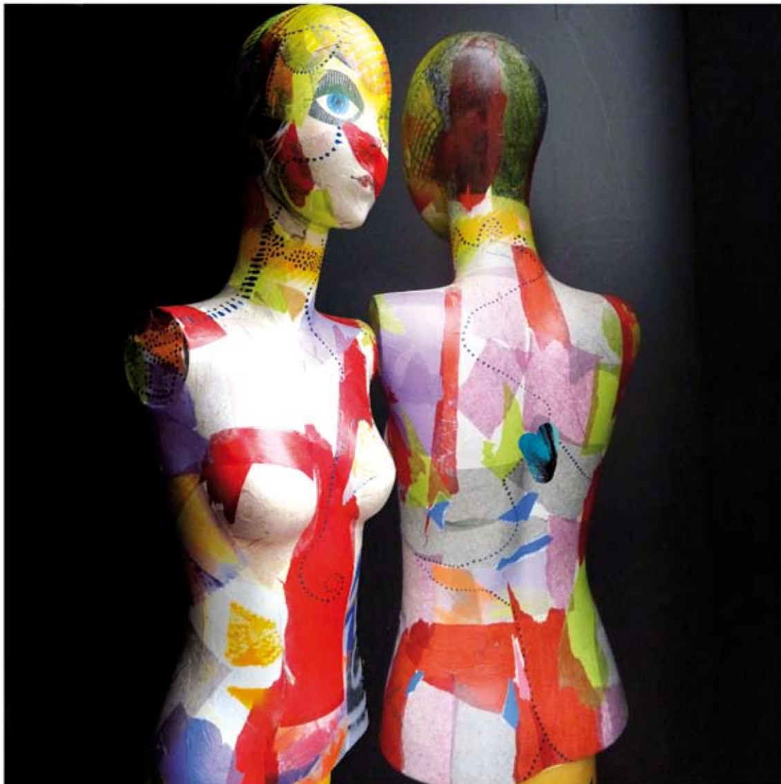
Sans titre : Bustes maroufflés 100 cm x 45 X2