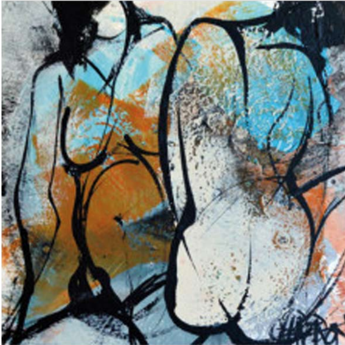
Sans titre ; Acrylique sur toile 100 cm x 100