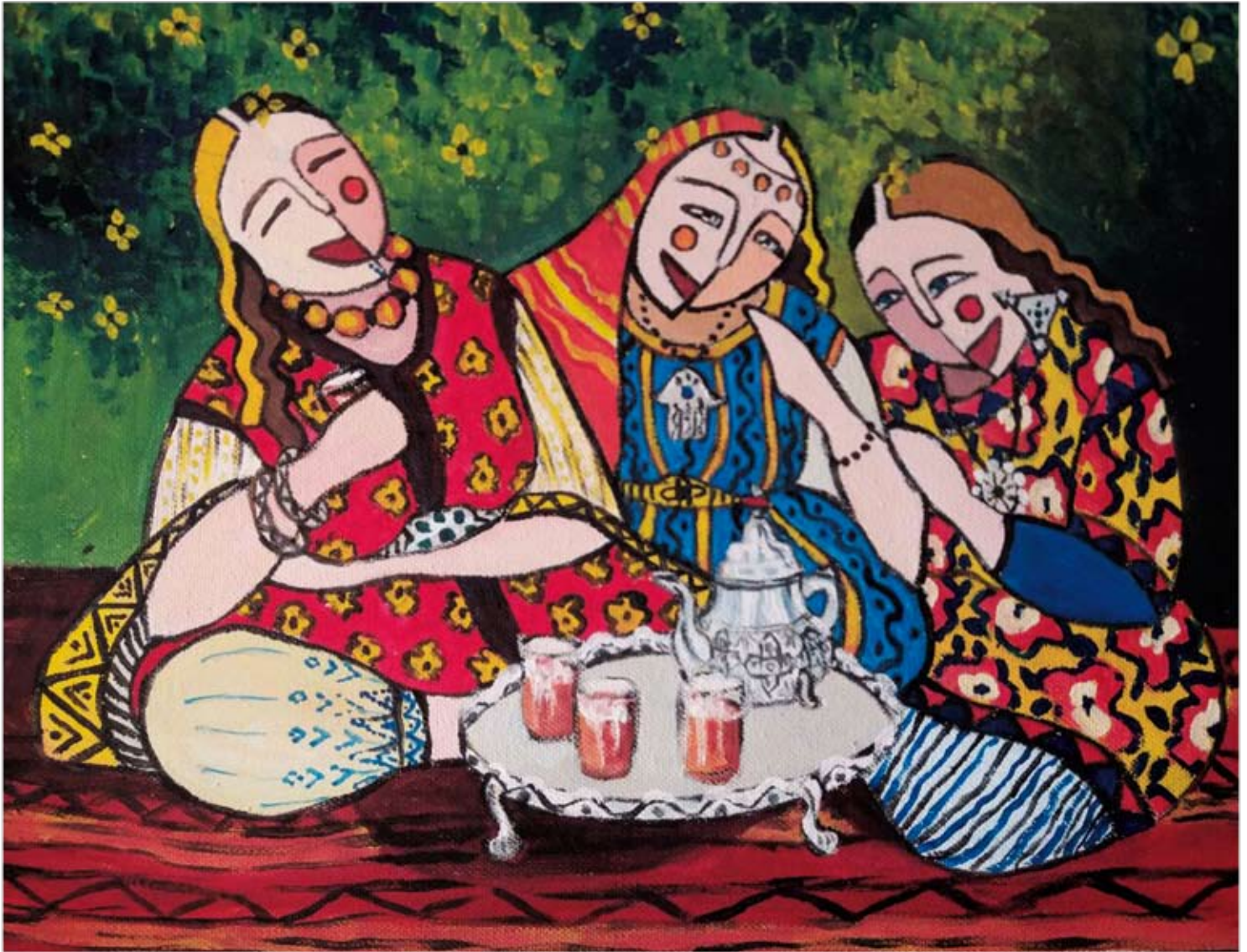
Sans titre : Acrylique sur toile 100 cm x 70