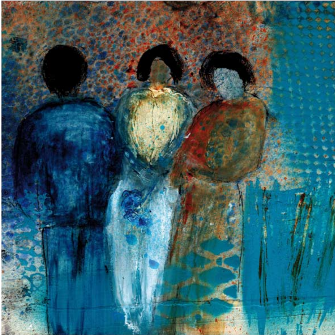
Sans titre ; Acrylique sur toile 100 cm x 100