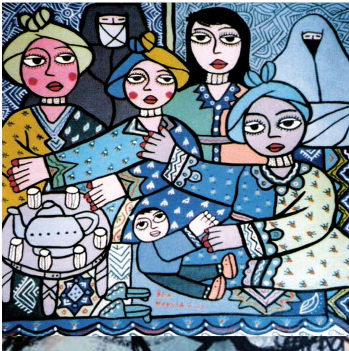
Sans titre ; Acrylique sur toile 100 cm x 100