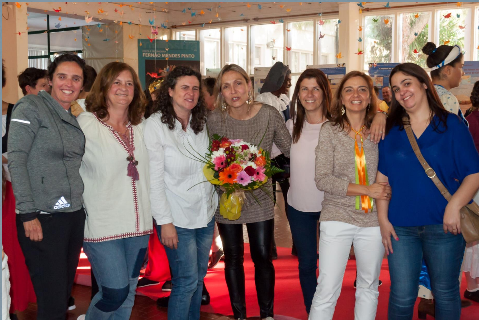
As mães (Capitãs da equipa)...