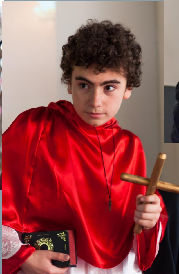
Cardeal Infante D. Henrique