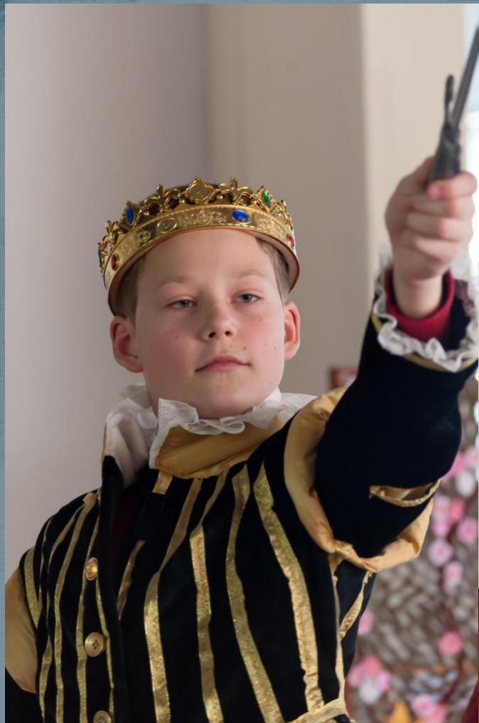
El Rei D. Sebastião