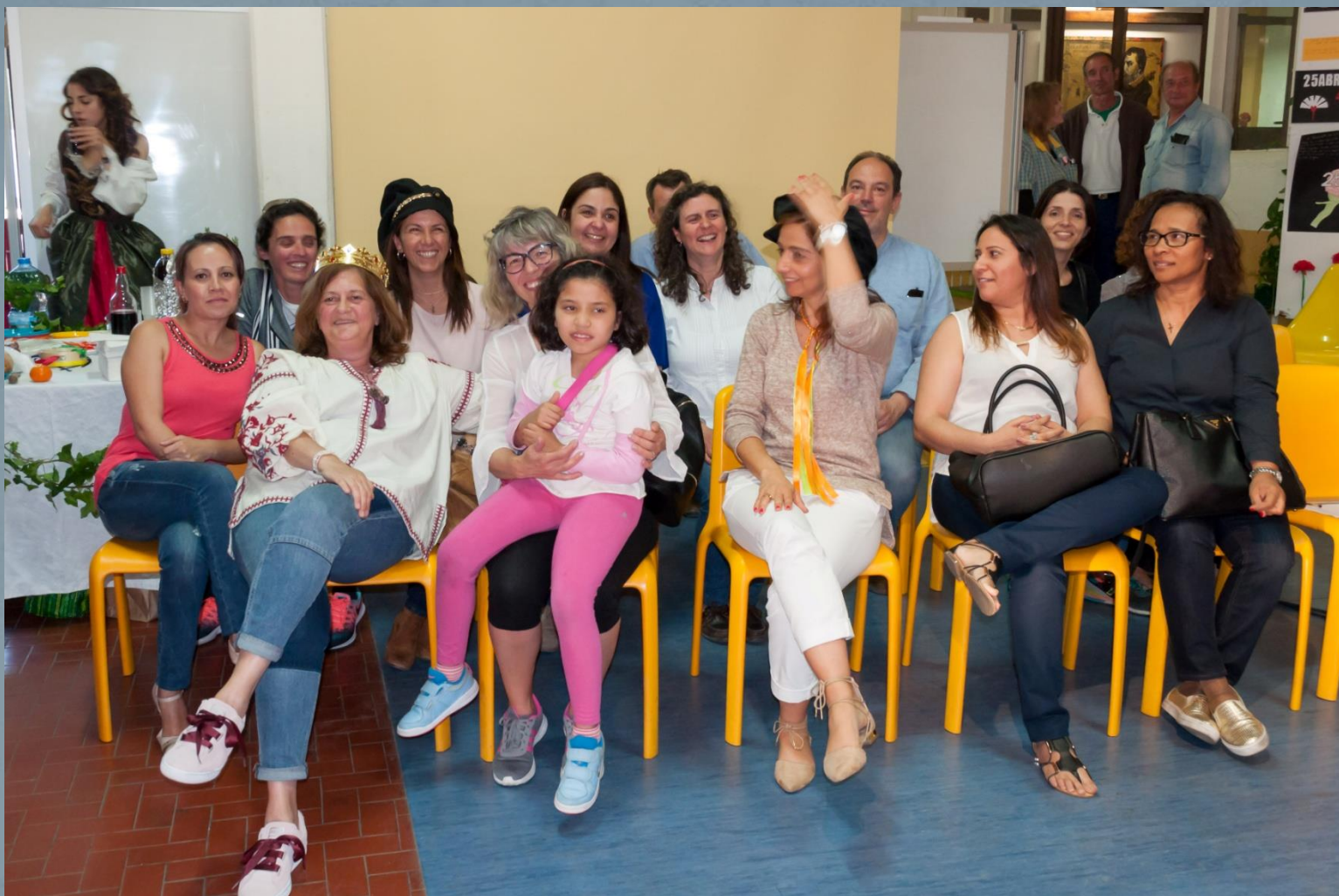
Os pais orgulhosos e felizes...