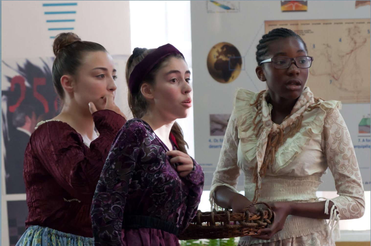
As Damas de Companhia