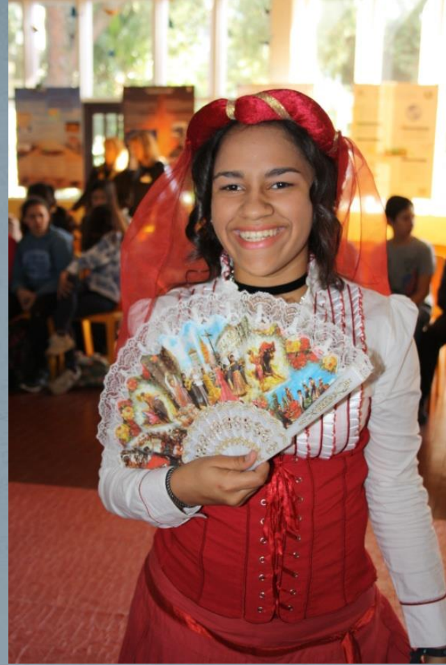
D. João de Bragança, Duque de Bragança e Conde de Barcelos e D. Catarina, Duquesa de Bragança e Condessa de Barcelos