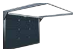
Basic (faste str.)