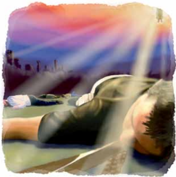
De ugudelige vil bli drept ved Jesu annet komme.

Svar: De ugudelige vil bli slått i hjel av Jesus.