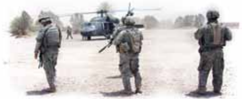
Strid mellom nasjoner er et tegn på Jesu annet komme.

Kristus har forutsagt det. Det burde overbevise oss om at Hans komme er nær.