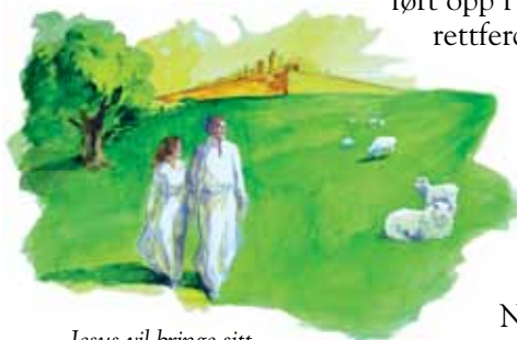
Jesus vil bringe sitt folk til himmelen og gjenskape i dem alt Adam og Eva mistet.

Svar: De rettferdige døde vil bli reist opp fra gravene, bli gitt en perfekt udødelig kropp lik den Kristus har, og ført opp i skyene for å møte Herren. Så vil også de rettferdige levende bli gitt legemer som Kristus og vil bli brakt opp i luften for å møte Herren. Og Jesus vil ta de rettferdige med seg til himmelen. Legg merke til at Jesus ikke stiger ned på jorden ved sitt annet komme. De hellige møter Ham “i luften”. Så Guds folk vil ignorere alle rapporter om at Kristus er i Baltimore, New Orleans, Los Angeles, etc. Falske messiaser vil oppstå og gjøre mirakler på jorden (Matt 24,23-27), men Jesus vil forbli i skyene over jorden ved sitt annet komme.