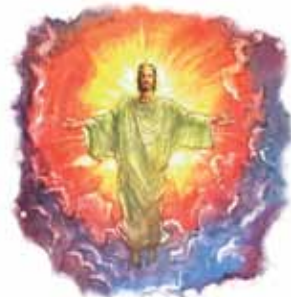
Jesus sa Han ville komme tilbake til jorden i skyene.

Svar: Skriften lover at Jesus vil vende tilbake til denne jorden på samme måte som ved Sin himmelfart — på en synlig, bokstavelig, legemlig, personlig måte. Matt 24,30 sier at “de skal se Menneskesønnen komme i himmelens skyer med kraft og megen herlighet”. Han vil bokstavelig talt komme i skyen, med en personlig identitet med en kropp av kjøtt og ben (Luk 24,36-43.50.51), og Hans komme vil bli synlig. Skriften er klar på dette.