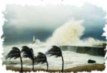
Frykt og redsel for fremtiden er tegn på Jesu komme.

“På jorden skal folkeslagene gripes av angst og rådvillhet. ... Mennesker skal bli maktesløse av frykt og gru for alt det som skal komme over jorden.” Luk 21,25,26.