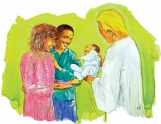
Familier vil bli gjenforent ved Jesu annet komme.

Svar: Jesus kommer tilbake til denne jorden for å belønne Sitt folk slik Han lovet, og for å ta dem med til det herlige hjemmet Han har gjort i stand for dem. Han vil gjenskape for Sitt folk Edens gleder og herligheter som Adam og Eva mistet ved å synde. Hans annet komme vil gjøre slutt på denne tidsalderens ondskap.