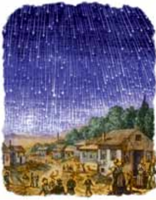
Det store stjerneregn fant sted den 13. nov. 1833.

strålende opplyst.”* Menneskene trodde at verdens ende hadde kommet. Undersøk dette. Det er i høyeste grad fascinerende og et tegn på Jesu komme.