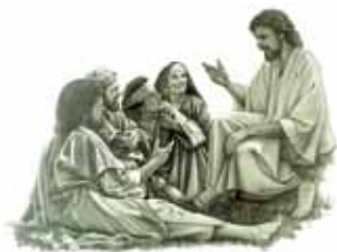
Jesus lærte at Han ville vende tilbake til jorden en annen gang.

“Slik ble Kristus ... skal Han vise seg for andre gang.” Hebr 9,28. “Når Jeg har gått bort og gjort i stand et sted for dere, skal Jeg komme igjen.” Joh 14,3.