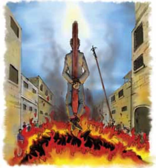
Bibelen sier at antikrist ville forfølge Guds folk.

Ikke glem — alle disse identifiseringene kommer direkte fra Bibelen. De er ikke menneskelige meninger eller spekulasjoner. Historikerne ville hurtig kunne fortelle deg hvilken makt som her er beskrevet. Disse punktene passer bare på en makt — pavemakten. Men for å være sikker, la oss vurdere alle ni kjennetegnene, ett for ett. Det kan ikke etterlates noen form for tvil.