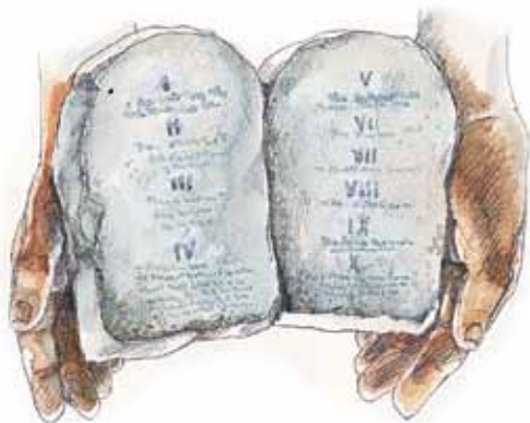
Bibelen sier at Antikrist ville forsøke å endre Guds lov.

I sin katekisme har pavemakten utelatt det andre budet som går imot tilbedelse av utskårne bilder og har kortet ned det fjerde budet fra 94 ord til åtte og delt opp det tiende budet til to bud. (Dette kan du selv sjekke.