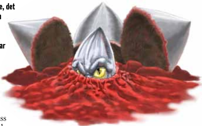
Det lille hornet i Dan 7,8 representerer antikrist.

“Jeg la nøye merke til hornene, og se, det var enda et horn, et lite et, som kom opp mellom dem. Tre av de første hornene ble rykket opp for å slippe dette fram. Og se, på dette hornet var det øyne som menneskeøyne og en munn som talte store ord.” Dan 7,8