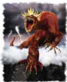
I profetier bruker Gud dyr for å symbolisere nasjoner.