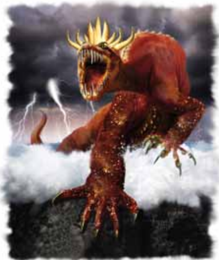
Det romerske verdensriket er symbolisert av et stort monsterdyr med 10 horn.

Svar: De 10 hornene representerer de 10 kongene eller rikene som det hedenske Rom endelig ble inndelt i (Dan 7,24). (Disse 10 rikene er de samme som de 10 tærne på statuen beskrevet i Dan 2,41-44.) Omstreifende barbariske stammer sveipet inn over det romerske imperiet og la under seg landområder for sitt folk. Syv av disse 10 stammene utviklet seg til å bli landene i det moderne Vest-Europa, mens tre ble rykket opp og ødelagt. Den neste seksjonen vil ta for seg de tre rikene som ble ødelagt.