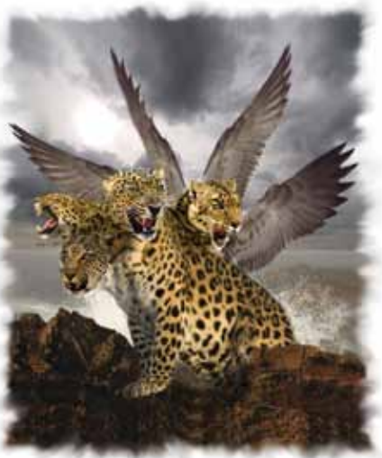
Leoparden i Daniel 7 representerer det greske verdensriket.