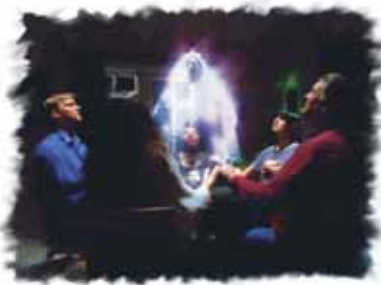
Medium og spåkoner som hevder å bli ledet av dødes ånder, er ikke fra Gud.

A. Magiker — en som trollbinder eller bruker trolldom.