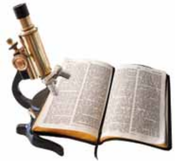
Ordet til en sann profet ledet alltid folket til et dypere studium av Bibelen.