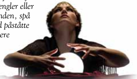
Gud snakker ikke til sitt folk gjennom krystallkuler

Merk: De fleste av disse falske profetene hevder å ha kontakt med de dødes ånder. Bibelen erklærer tydelig at de døde ikke kan kontaktes av de levende. (Studiehefte 10 inneholder mer informasjon om de døde.) De påståtte dødes ånder er onde engler eller djevlerv (Åp 16,13.14). Krystallkuler, spå i hånden, spå i kaffegrugg, stjernetyding og kommunisere med påståtte avdødes ånder, er ikke Guds måte å kommunisere med sitt folk. Skriften lærer at alle som blir involvert i slike ting er vederstyggelige (5 Mos 18,12). Og det som verre er, de som fortsetter dette engasjementet, vil bli utestengt fra Guds rike (Gal 5,19-21; Åp 21,8; 22,14.15).