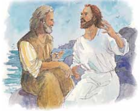
Ordene fra en sann profet er et spesielt budskap fra Jesus til hans folk.

Svar: "Jesu vitnesbyrd" betyr at ordene fra en profet kommer fra Jesus. Følgelig må vi anse ordene fra en sann profet som et spesielt budskap fra Jesus til oss (Åp 1,1; Am 3,7). Det er ekstremt farlig å bringe vanære over en sann profet. Det er det samme som å bringe vanære over Jesus, som sender dem og leder dem. Ikke noe å forundres over at Gud advarer. "Rør ikke Mine salvede, og gjør ikke Mine profeter noe ondt!" Sal 105,15.