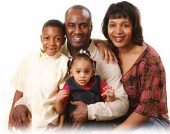
Disse fire menneskene er fire sjeler.

Det er ingenting mystisk med ånden som returnerer til Gud ved døden. Det er bare livspusten.