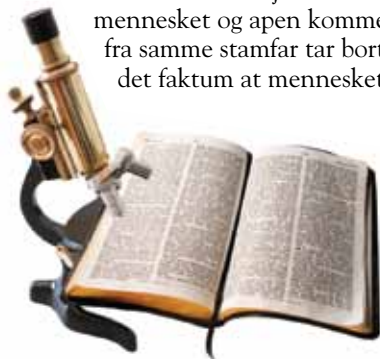
Sann vitenskap er alltid i harmoni med Bibelen fordi Gud er opphavet til begge deler.

3. De varierende tidsepoker av de forskjellige jordlagene i Grand Canyon, som nå blir datert ved bruk av nåtidens moderne vitenskapelige metoder, i kontrast til tidligere dateringer, viser at evolusjonistenes målemetoder har vært ubegrunnet og uforsvarlige. Den ateistiske teorien fra evolusjonen om at mennesket og apen kommer fra samme stamfar tar bort det faktum at mennesket er