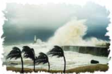
Den asiatiske tsunamien i 2004 var en av de dødeligste naturkatastrofer i moderne tid.

Svar: Det økende antall av naturkatastrofer og den voksende terrorismen som utspinner seg verden over, er tegn som er forutsagt i Bibelen. Bibelen forutsier at følgende skjer ved tidenes ende: "Og på jorden skal folkene engstes i fortvilelse når hav og brenninger bruser." (Luk 21,25).