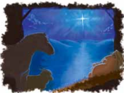
Jesu oppfylte mer enn 125 profetier om Messias i Det Gamle Testamentet.