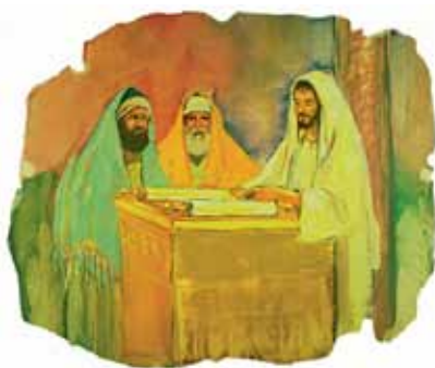
Jesus siterte Bibelen og bekreftet dens pålitelighet.

Svar: Jesus siterte Skriften når Han møtte Satans fristelser, og Han presiserte at Bibelen er pålitelig og sann. (Joh 17,17). Jesus siterte ofte Bibelen som autoritet for den sannhet Han underviste.