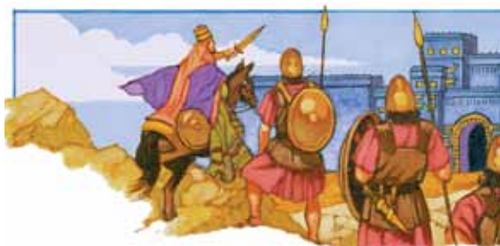
Før Kyros ble født nevnte de bibelske profetiene ham som en general som ville innta Babylon.