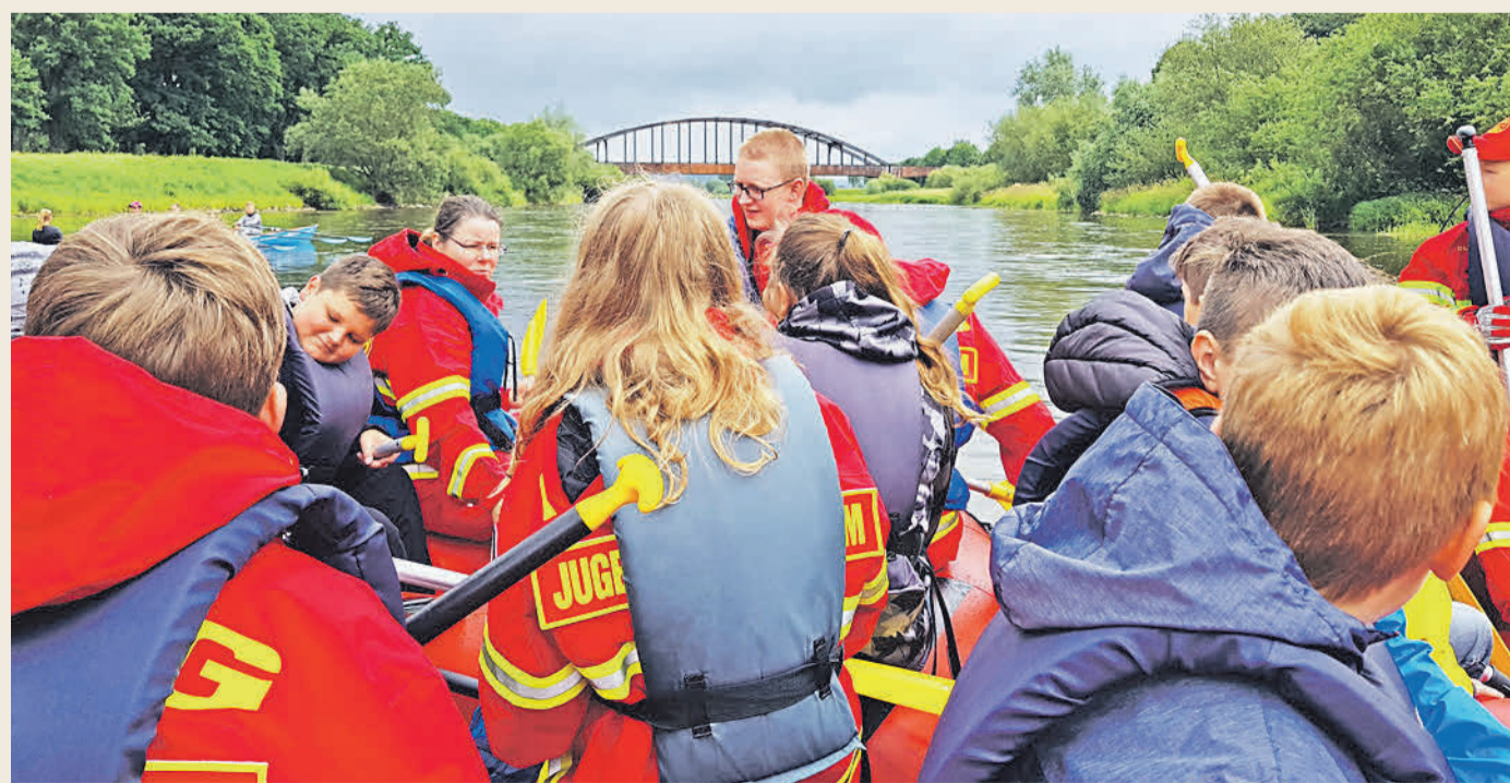
Verschnaufpause nach einem Wettrennen Höhe Corvey.

staltung mit einem Grillen ausklingen zu lassen. Mit der Fahrt verabschiedete sich das Kinderschwimmtraining in die Sommerpause und wird erst ab dem 13. August im Freibad Holzminden fortgesetzt.