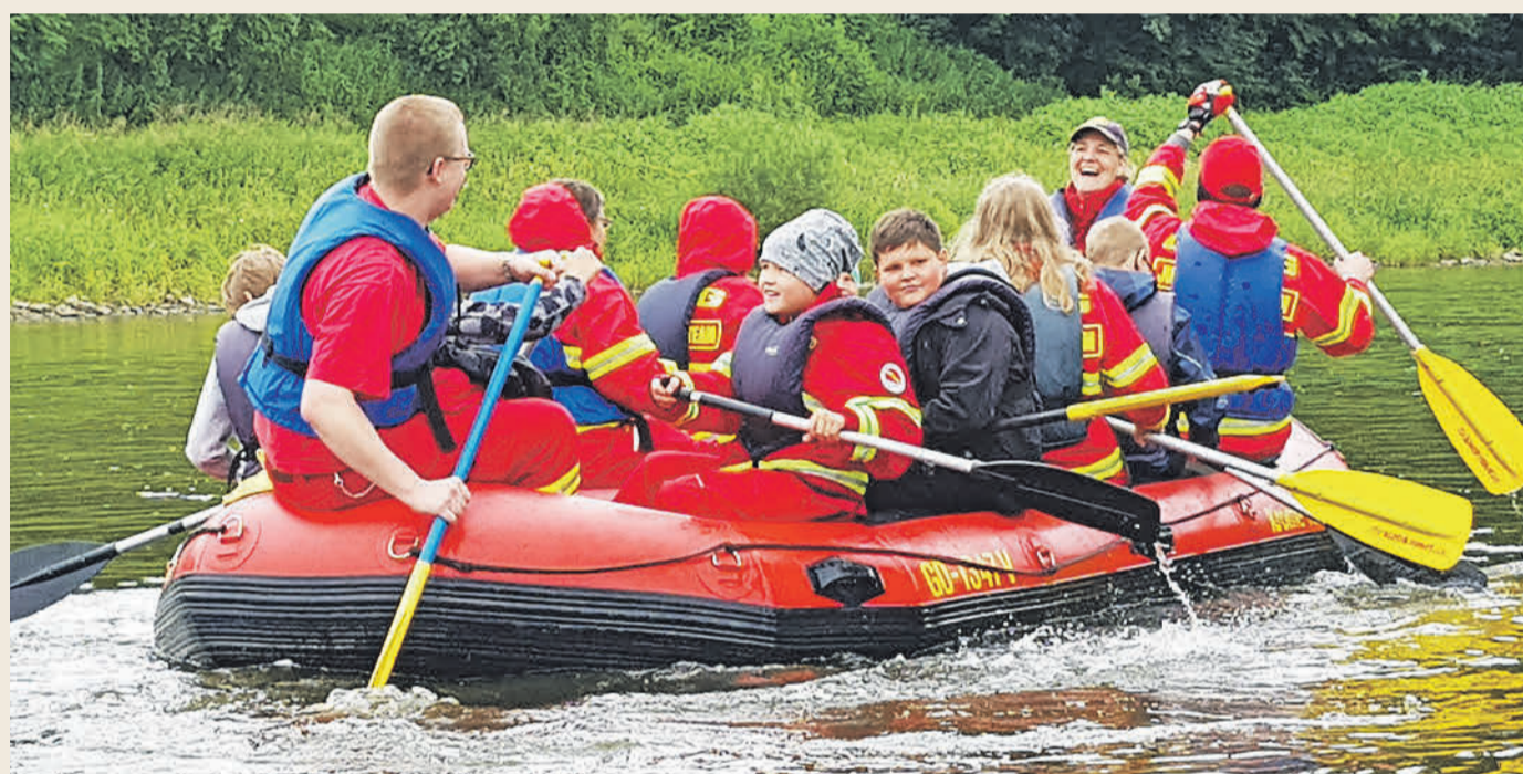
Gute Stimmung auf der Weser.