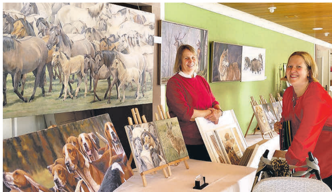
Stände laden parallel zur Reitjagd im Haus des Gastes zum Stöbern ein.