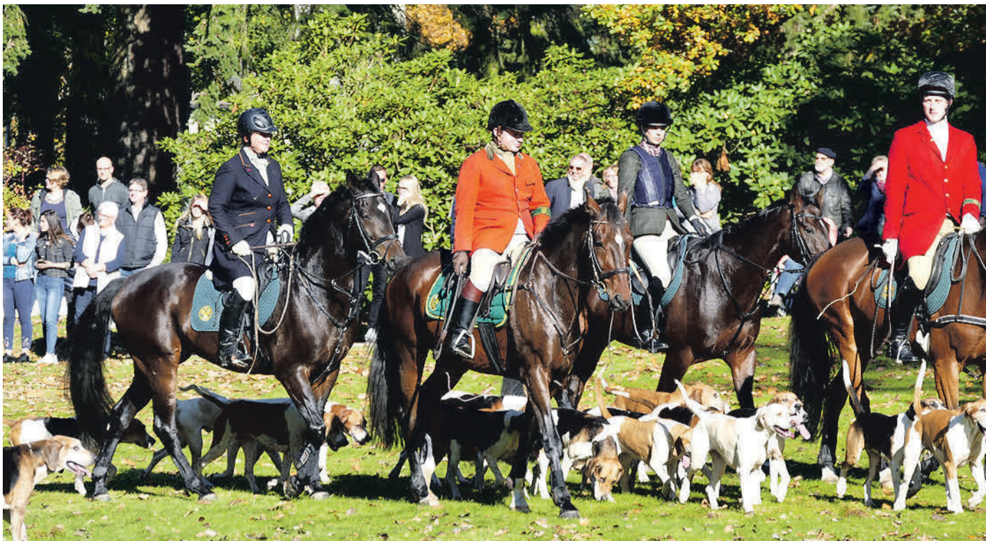
Die Jagd beginnt mit dem Stelldichein am Haus des Gastes.

Der „Stopp“ am Grillplatz Silberborn ist für 13.30 Uhr geplant. Gegen 15 Uhr ertönt