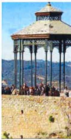
Pérgola de Blas Infante.