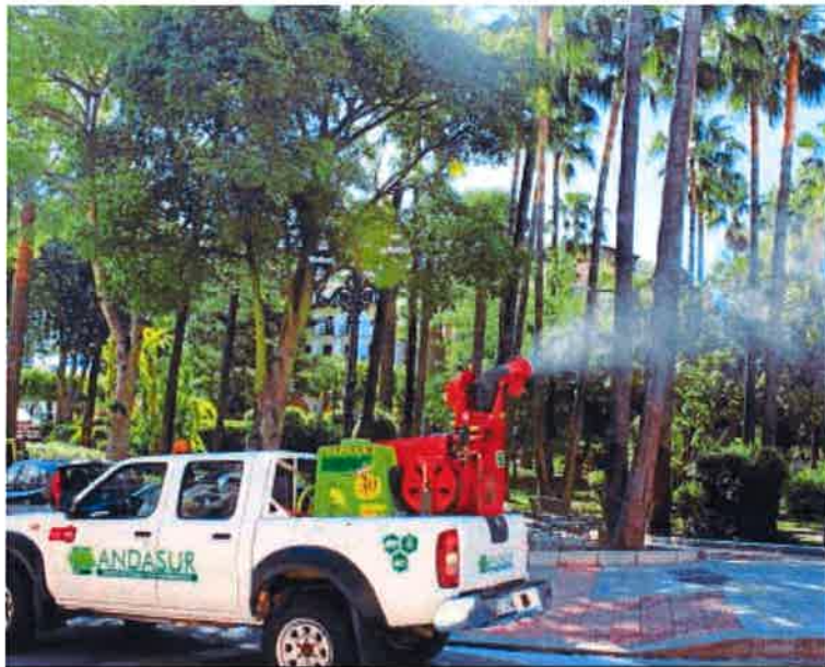
Primeros trabajos de tratamiento contra el mosquito en Alhaurín de la Torre.

Repartirá 6.000 trípticos para informar sobre como actuar en el ámbito doméstico