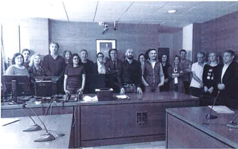
Los trabajadores de ambos juzgados de lo penal, así como procuradores y abogados , secundaron este acto de protesta