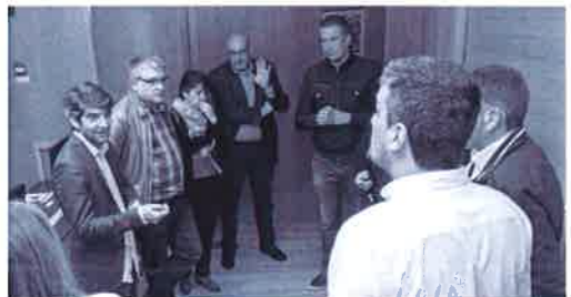
Momento en el que los alcaldes esperaban a la conselleira de Infraestruturas

Asimismo, desde la consellería añadieron que se les trasladó que se buscaría una fecha para el encuentro y la intención de que estuviesen también representantes del Ministerio de Fomento, competente en la materia en cuestión. Finalmente, la reunión se celebrará el próximo 27 de abril a las 17.00 horas en el edificio administrativo de la Xunta en Ferrol. ●