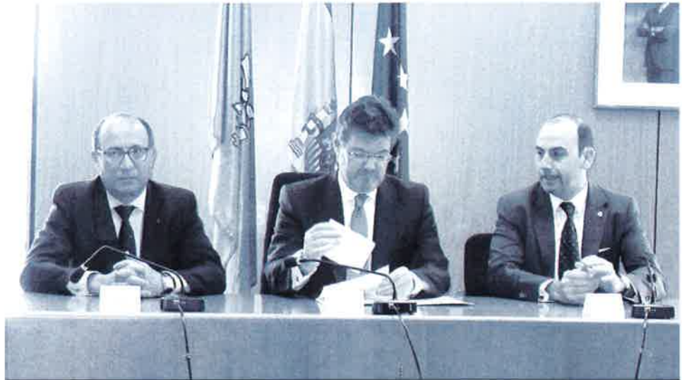
El delegado del Gobierno, el ministro de Justicia y el juez decano de la ciudad, ayer en la reunión con los operadores jurídicos.