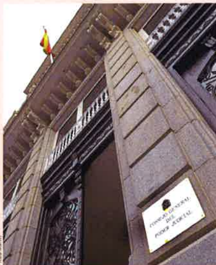
Sede del Consejo General del Poder Judicial.

Esta solución ya se utilizó en el pasado, aunque a menor escala, con motivo del conflicto de las participaciones preferentes de cajas rescatadas. En esta ocasión, la propuesta consiste en que cada comunidad autónoma designe un juzgado de primera instancia que, de manera exclusiva y no excluyente, se especialice en estos procesos. Por su volumen, la medida irá acompañada por medidas de refuerzo de personal. Es decir, pasará