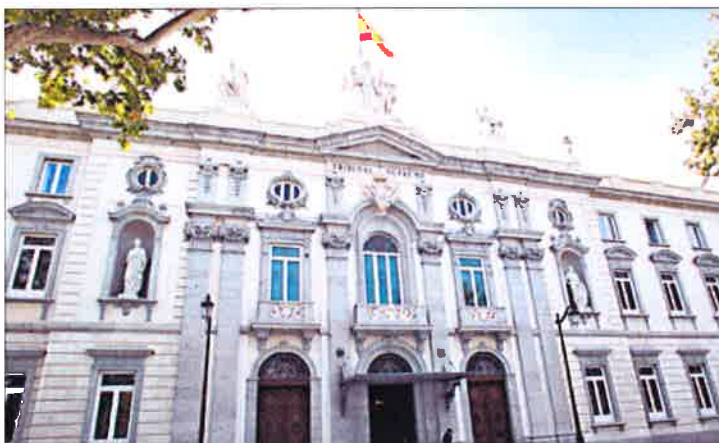
Sede del Tribunal Supremo, en la plaza de las Salesas de Madrid.

La idea, basada en la experiencia obtenida especializando algunas sedes en las demandas sobre preferentes, es seleccionar los juzgados que se ofrezcan voluntarios o, en su defecto, aquellos que mejor situación tengan en cada provincia. Estos juzgados se dedicarán de forma exclusiva, aunque no excluyen-