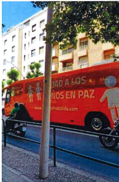
El autobús, por las calles del centro.

El portavoz de IU, Francisco Puentedura, que instó al Ayuntamiento a tomar medidas, informó de que IU se concentró por donde pasaba el autobús para mostrar su oposición a mensajes como "Si naces hombre, eres hombre. Si eres mujeres, seguirás siéndolo. Que no te engañen".