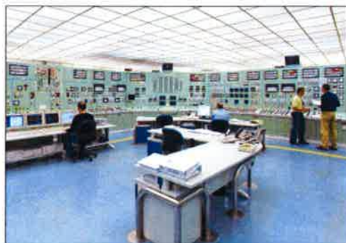
Imagen de trabajadores en el interior de la central burgalesa.

A la hora de analizar las causas del suceso, se comprobó que la pínula eléctrica «estaba funcionando con tres pestillos operativos de los cuatro que posee». No obstante, Nuclenor argumentó que «la holgura entre el pestillo y el aro metálico es suficiente para que con tres pestillos operativos se sostenga el contenedor». Pese a ello, una vez solucionada la incidencia, se estableció la obligación de comprobar el «correcto funcionamiento» de los pestillos antes de utilizar las pínulas. En caso de no ser correcto, se prohibirá su utilización pa-