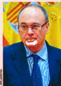
Luis María Linde, gobernador del Banco de España.

Este grupo interno del Banco de España cuenta con representantes de todas las direcciones generales y se reúne aproximadamente una vez al mes. Con ello, el Banco de España quiere garantizar un