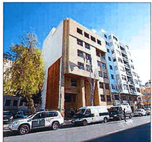
Los juzgados de Eivissa sufren constantes problemas informáticos.

Ni la navegación por internet, ni los sistemas empleados por Toxicología, la videoconferencia ni la grabación en las salas de vista sufrieron ningún problema, añadieron desde Justicia.