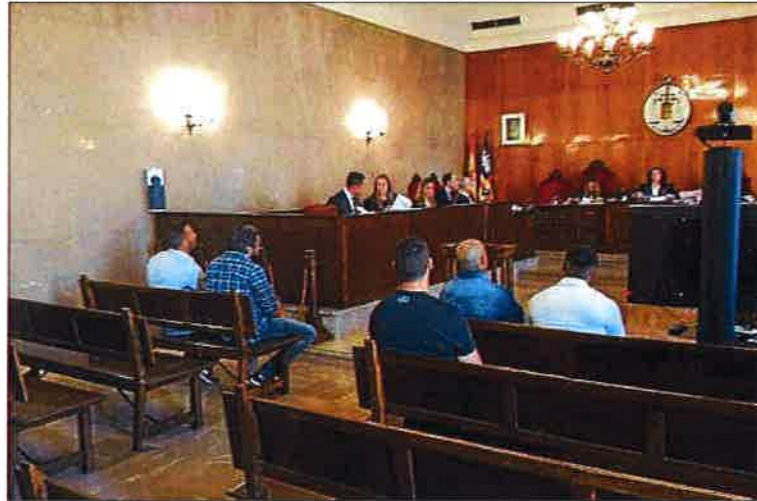
Un momento del juicio, celebrado ayer en Palma. M. O. L.

El fiscal solicita para los cinco procesados penas que oscilan entre uno y doce años de cárcel. Varios abogados solicitaron al inicio del juicio la nulidad de los pincha-