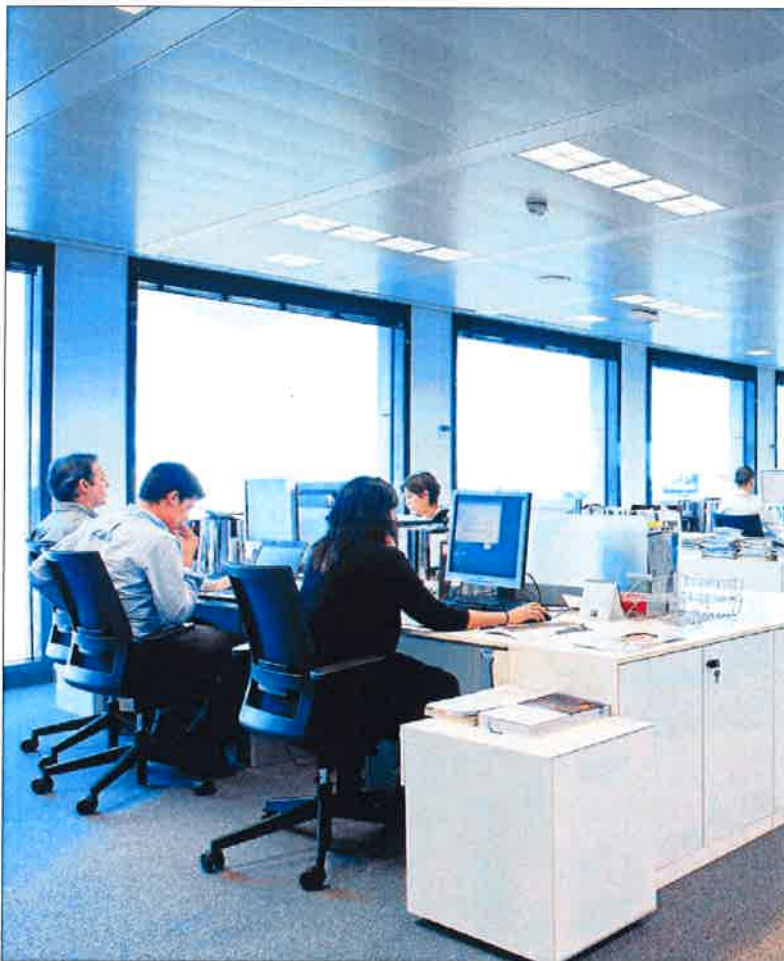
La UPM representa a 50.000 profesionales. LA OPINIÓN

► La OCDE recomienda aprobar la reforma de los servicios profesionales y la Unión Profesional presenta las alegaciones al Consejo de Estado sobre el proyecto de Real Decreto sobre cualificaciones profesionales