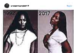
25 años después, Naomi Campbell sigue llevando los 'shorts' como nadie