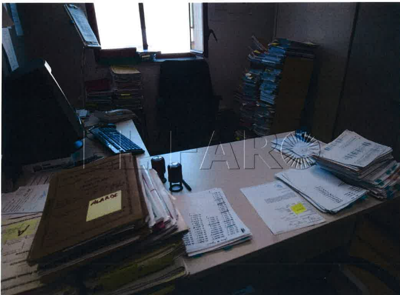
CCOO afirma que el 'papel cero' ralentiza la Justicia