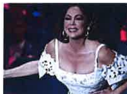
Isabel Pantoja, y todas las amistades que dejó atrás

Colectivos exigen a la Junta una "apuesta clara y decidida" por la escuela pública