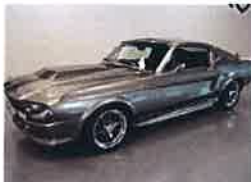
¿Sabes cuál es el top de coches clásicos más caros del mundo?