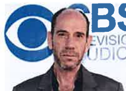
Muere el actor Miguel Ferrer, clásico secundario de cine y TV