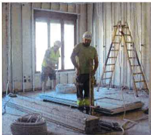
Los operarios trabajan en el interior del edificio número 6 de la plaza San Juan

En el primer sótano estarán los archivos y los calabozos y en el segundo, las dependencias del Instituto de Medicina Legal de Aragón (IMLA) y el Tribunal de Menores, con un acceso independiente.