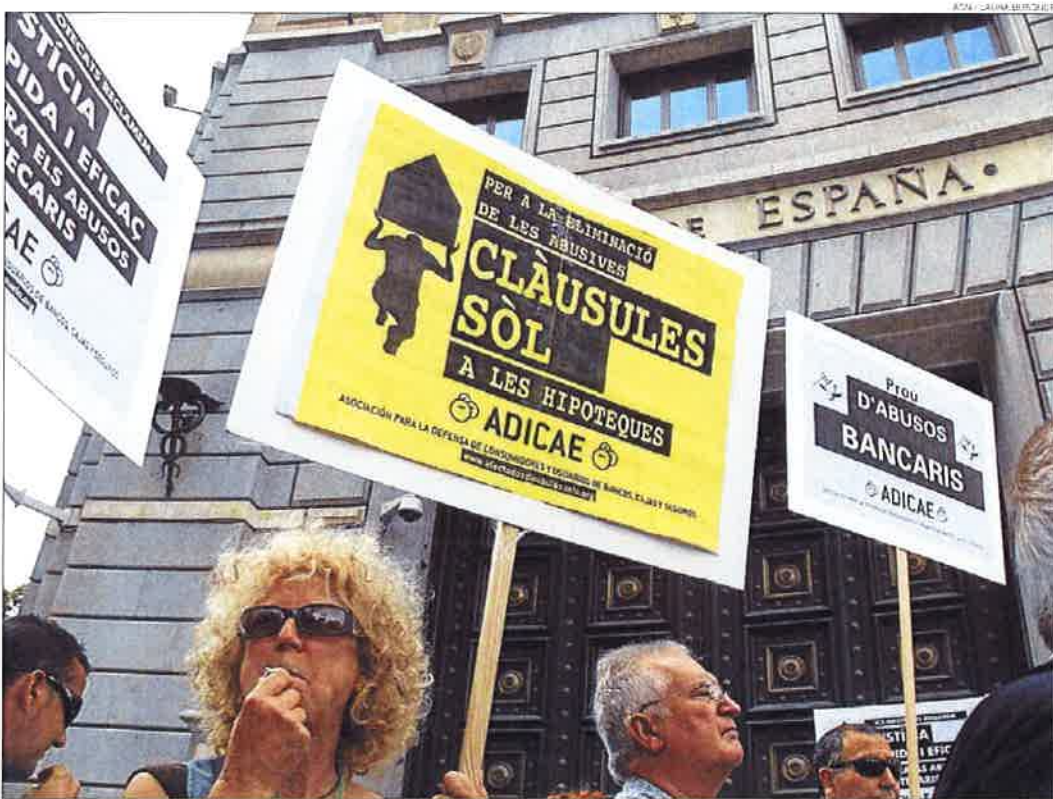
►► Protesta contra las cláusulas suelo ante la sede del Banco de España en Barcelona, en junio del 2015.