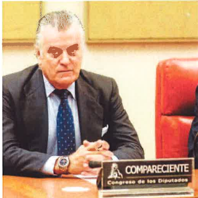
El extesorero del PP Luis Bárcenas, en la comisión del Congreso

La informalidad llega hasta el extremo de que se solicitan «las nueve carpetas de colores entregadas por Luis Bárcenas, el 15 de julio de 2013, al juez Pablo Ruz». O, directamente, piden «los papeles de Bárcenas», el extesorero nacional del PP.