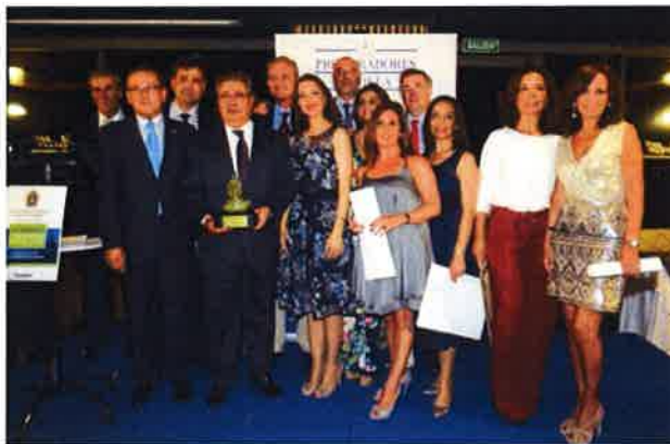
El ministro, con los procuradores que recibieron las insignias por los 35 y 25 años de trayectoria profesional

El emotivo vídeo de Interior en homenaje a Miguel Ángel Blanco