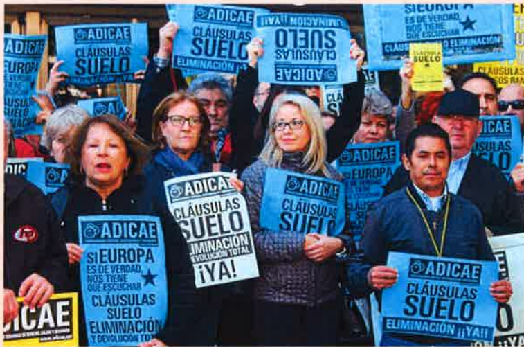
Imagen de una manifestación de afectados por las cláusulas suelo.

Según el sindicato CSI-F, a 21 de junio, el juzgado encargado de conocer estos asuntos en Madrid –el de primera instancia 101 bis– había registrado 2.167 demandas, lo que representa la entrada de más de 150 demandas diarias. “Es