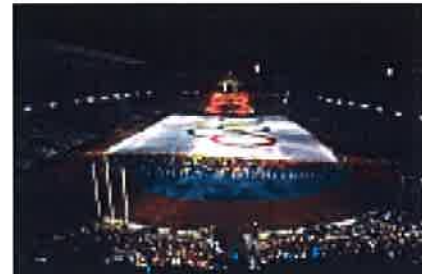
La herencia de Barcelona 92: un sector de 3.500 millones y 500 empresas