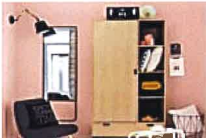
Rebajas en muebles y decoración. ¡Corre, se terminan pronto! (Maisons du Monde)