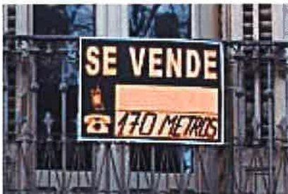
Inversores en shock: Un piso en Paseo de Gracia por 50€ (EIPaisFinanciero)