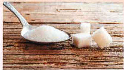
El Supremo confirmó en dos ocasiones multas al cártel del azúcar.

elevado los precios pagados por estas empresas en 1995 y 1996 en el mercado del azúcar para uso industrial. Se trataba de un fallo pionero, que confirmó los procedimientos de la Comisión Nacional de la Competencia (CNC), el organismo integrado ahora en la Comisión Nacional de los Mercados y de la Competencia (CNMC). Menos de dos años más tarde el TS zanjó el conocido como ‘cártel del azúcar’ y condenó a Ebro Foods a