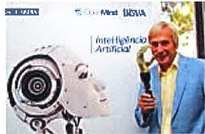
¿Sabías que la mente humana piensa en 3 dimensiones y la inteligencia artificial en 5? (BBVA)