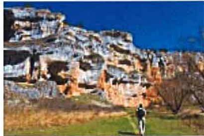
Ruta por el Cañón de río Lobos, Soria | Guía Repsol (Guía Repsol)