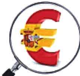
Cómo Invertir Sabiamente Pequeñas Cantidades (Vici)