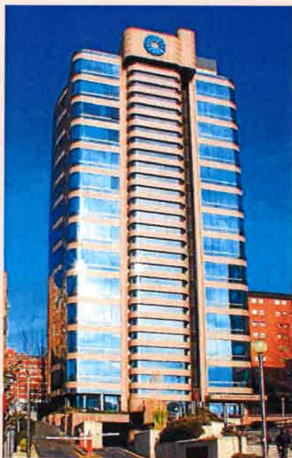
Sede de la Audiencia Provincial de Madrid.

La sentencia de la Audiencia Provincial de Madrid llega poco después de la entrada en vigor del Real Decreto Ley 9/2017, de 26 de mayo, que transpone la directiva europea sobre daños. “Es relevante para las futuras acciones privadas del derecho de la competencia por cuanto ha sido dictada en un momento en el que la actual normativa facilita esas reclamaciones de daños y perjuicios por ilícitos antitrust ”, subraya el socio de Bird & Bird, quien señala que “se trata de uno de los primeros casos de este tipo de reclamaciones de daños en España, con la dificultad de que se