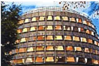
El conflicto catalán acapara el trabajo del Constitucional