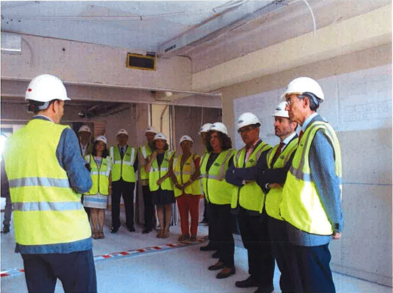
Visita a las obras del Palacio de Justicia

La primera fase de las obras de adaptación del Palacio de Justicia de Teruel a la Nueva Oficina Judicial (NOJ) estará terminada a principios de noviembre. La constructora encargada de los trabajos tratará hasta entonces de agilizar sus actuaciones para que el edificio que está siendo remodelado, el número 6 de la plaza San Juan, recupere cuanto antes su utilidad.