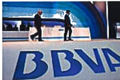
BBVA competirá con los ETF con fondos de muy bajo coste