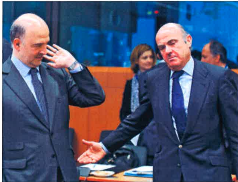
El comisario europeo Pierre Moscovici (izquierda), con el ministro de Economía, Luis de Guindos.

Los análisis de Bruselas son interesantes por el lado de la evolución económica, pero se convierten en fundamentales por el lado fiscal: la estrecha vigilancia del déficit español estuvo a punto de costarle una multa multimillonaria al Gobierno el pasado verano, y la Comisión sigue marcando en