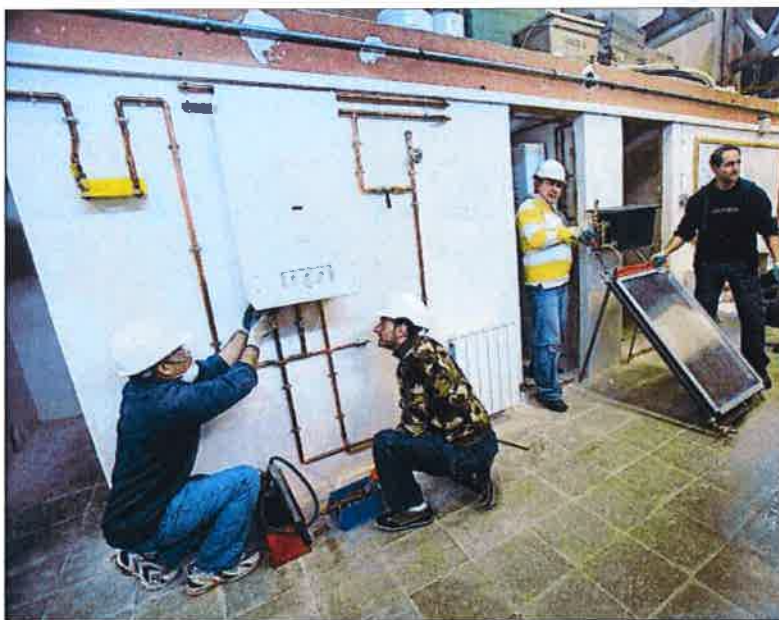
La patronal reclama protagonismo para las empresas en el diseño de formación

DISTRIBUCIÓN "EXCESIVA" De los 2.000 millones anuales por cuotas de cotización, unos 1.000 van a desempleados