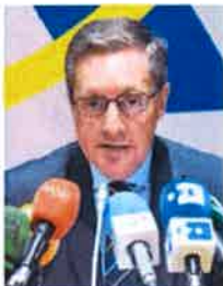
El director de la Agencia Tributaria, Santiago Menéndez.

Las más habituales son por Internet, durante las 24 horas del día, a través de www.agenciatributaria.es con NIF/NIE o DNI electrónico, certificado electrónico, Cl@ve PIN o referencia. También es posible hacerlo por teléfono en los números 901 223 344 o 915 530 071 aportando el NIF/NIE, en este caso de lunes a viernes entre las 9.00 y las 19.00 horas.