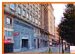
Plaza de Vigo