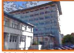
Calle Juan Varela