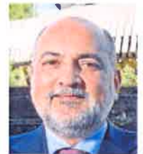
FRANCISCO PÉREZ DE LOS COBOS PRESIDENTE DEL TC «La reforma de la Constitución debe hacerse con reflexión»