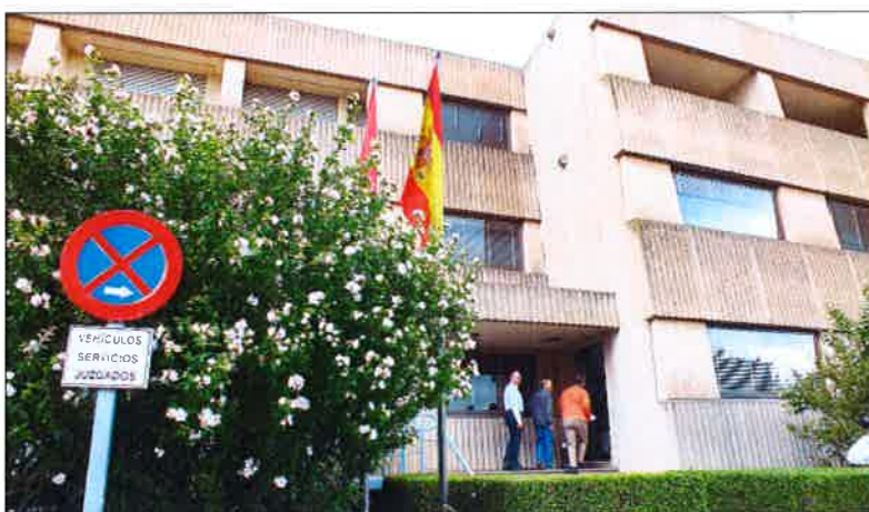
El TSJ de Castilla y León incluye desde hace años en su memoria anual el reclamo de un tercer juzgado para la ciudad.

en la ciudad, sino que lo hace una jueza sustituta de manera temporal.