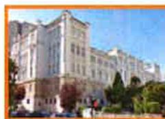
Plaza de Galicia

Asumirá, entre otros organismos judiciales, el Juzgado de Menores, la Audiencia Provincial, la Fiscalía, la Junta Electoral, el Colegio de Abogados y el de Procuradores