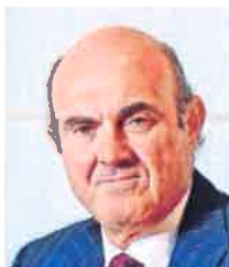
LUIS DE GUINDOS MINISTRO DE ECONOMÍA Y COMPETITIVIDAD «España debe insistir en las reformas para mantener nuestro diferencial de crecimiento»