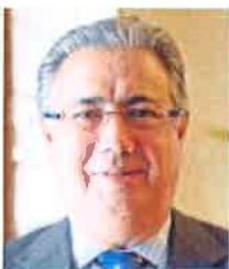
JUAN IGNACIO ZOIDO MINISTRO DEL INTERIOR «Mi mayor logro al frente de Interior sería no tener que comparecer nunca ante los medios para informar de un atentado»