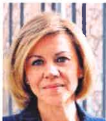
MARÍA DOLORES DE COSPEDAL MINISTRA DE DEFENSA «Es un momento crucial para la construcción de la Defensa Europea. Hay que actuar de forma decidida»