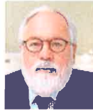
MIGUEL ARIAS COMISARIO ENERGÍA «El objetivo es que en 2020 logremos una interconexión eléctrica del 10%»