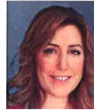
SUSANA DÍAZ PRESIDENTA DE LA JUNTA DE ANDALUCÍA «2017 va a ser el año del fortalecimiento del PSOE»