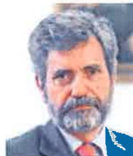
CARLOS LESMES PRESIDENTE DEL TS Y DEL CGPJ «Los jueces son independientes en el ejercicio de su función»