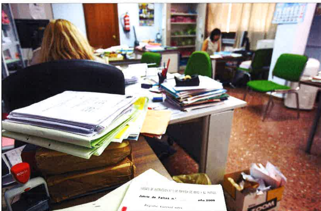
Los dos juzgados con los que cuenta la ciudad asumen un excesivo volumen de trabajo.

En el caso de Miranda, el pasado mes de septiembre se publicó la adjudicación de una de las plazas de juez, pero su titular solicitó simultáneamente una comisión de servicios para reforzar el Juzgado de lo Mercantil número 1 de Burgos, donde ya ejercía como apoyo, siéndole concedida por seis meses y renovada por otro medio año con relevación de funciones en el Juzgado de Miranda, por lo que realmente el titular no ejerce