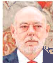
JOSÉ MANUEL MAZA FISCAL GENERAL DEL ESTADO «Tomamos como prioridad la agilización de la Justicia»