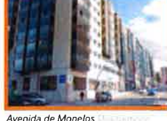
Avenida de Monelos