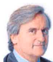
ROMÁN OYARZUN EMBAJADOR DE ESPAÑA ANTE LA ONU «El impacto de las decisiones es más alto cuanto más apoyos»