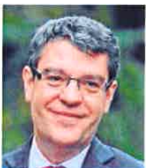
ÁLVARO NADAL MINISTRO DE ENERGÍA Y AGENDA DIGITAL «Este año, las perspectivas del sector turístico son todavía mejores que las de 2016»