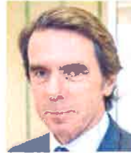
JOSÉ MARÍA AZNAR PRESIDENTE DE FAES «Los acuerdos de Estado no son posibles sin objetivos comunes»

ABC ofrece mañana gratis a sus lectores un número especial que reúne a cien personalidades del mundo de la economía, la empresa, el derecho, la política, la ciencia, la cultura, la Iglesia o el deporte y les ha preguntado por sus proyectos y previsiones para 2017. ABC reconoce en 100 nombres lo mucho de excelente que tiene España y que merece darse a conocer, pero también ser motivo de orgullo por parte de todos.