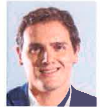
ALBERT RIVERA PRESIDENTE DE CIUDADANOS «No creo que nadie piense en desestabilizar otra vez el país»