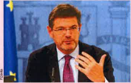
El ministro de Justicia, Rafael Catalá.

También deberá ocuparse de la gestión y administración de usuarios y de comunicar a Justicia los interlocutores válidos en materia de adminis-