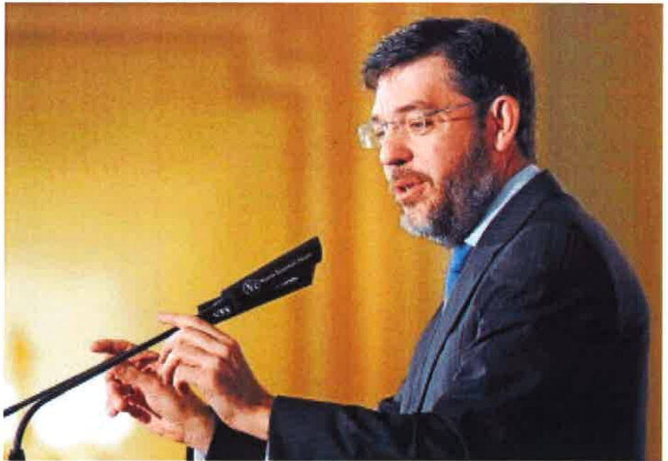
Alberto Nadal, secretario de Estado de Presupuestos

Para el próximo año, Hacienda, augura que se alcanzará la mayor recaudación de la historia, un 7,9% más que en 2016. Por el momento los ingresos respaldan estas previsiones: el secretario de Estado de Hacienda anunció que la recaudación tributaria aumentó un 11% hasta abril de 2017 frente al año pasado. Solo en abril, señaló, el alza fue del 21%: en el IRPF el aumento fue del 7,1%; en IVA fue del 12,2% y en los Impuestos Especiales, del 5,7%.