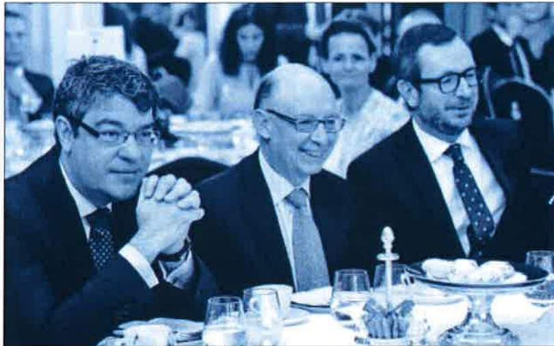
Los ministros de Energía y Hacienda, Álvaro Nadal y Cristóbal Montoro, y Javier Maroto, ayer en un desayuno en Madrid.

Más llamativa aún es la evolución del IVA, ya que en 2007 los ingresos por este concepto fueron de 55.851 millones, mientras que para este ejercicio el Gobierno espera alcanzar los 67.463 millones. O dicho de otra forma: 11.612 millones más que evidencian un aumento del 20,7%. Una parte de este abultado incremento, cierto es, se debe a las medidas que el Ejecutivo ha implantado sobre los aplazamientos y el control del impuesto a las empresas. Pero esta circunstancia no evita, ni mucho menos, que el endurecimiento de IVA soportado por los ciudadanos resulte básico en el marcado incremento.