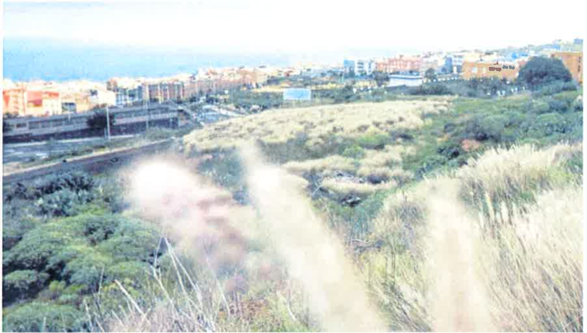
EL SOLAR DE LA CALLE DE LOS BIMBACHES, AL SUROESTE ES EL PREFERIDO POR GOBIERNO Y AYUNTAMIENTO, PERO EL S

La decisión viene a dar la razón al Ayuntamiento de Santa Cruz, que "siempre ha defendido su derecho a personarse en esta fase del proceso judicial en marcha". Aunque el juzgado rechazó en principio la personación municipal que ahora sí admite la Audiencia, no eran pocos los juristas que mostraban su extrañeza por la ausencia del Ayuntamiento en un asunto donde estaba involucrado nítidamente, anomalía que frustraba cualquier intención del Consistorio de abogar por sus derechos al respecto, y más cuando la implicación de otras administraciones dificultan la ejecución de la sentencia que nos ocupa.