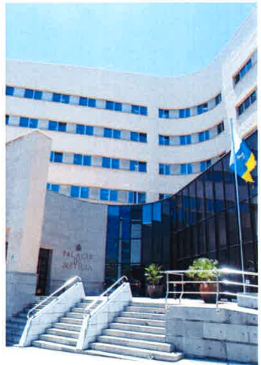
EL JUICIO SE PROLONGARÁ, AL MENOS, HASTA EL PRÓXIMO JUEVES. Fran Pallero

La hija de la fallecida vive en La Laguna junto a su marido con discapacidad, y en la exposición del Ministerio Fiscal se destacó que los únicos ingresos que tenían estas personas durante