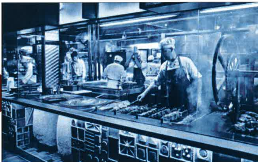
Cocinas del restaurante Amazónico de Madrid. ÁNGEL NAVARRETE

lejos de los 2,5 millones que rozó en los años del boom inmobiliario.