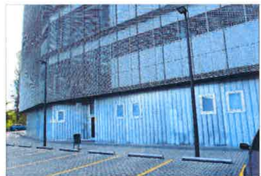
Las ventanas airean el Imelga y el juzgado de guardia.

La apertura de las primeras ventanas —y, en principio, las únicas—, en la parte inferior de la fachada trasera —la mayoría de la cubierta es de malla metálica— se incluye en un plan de obras de 82.000 euros que también incluye reformas en el viejo edificio del Pazo de Xustiza. En el nuevo ya está a punto la antigua sala de procuradores (los profesionales fueron trasladados hace meses a una sala de bodas exterior que no llegó a officiar enlace alguno). Este espacio acogerá en los próximos días la oficina de atención al ciudadano. Pese a ser uno de los que más consultas recibe cada día, la puesta en marcha del edificio desempeñó sus funciones en el mismo sótano, pero en un lugar aleja-