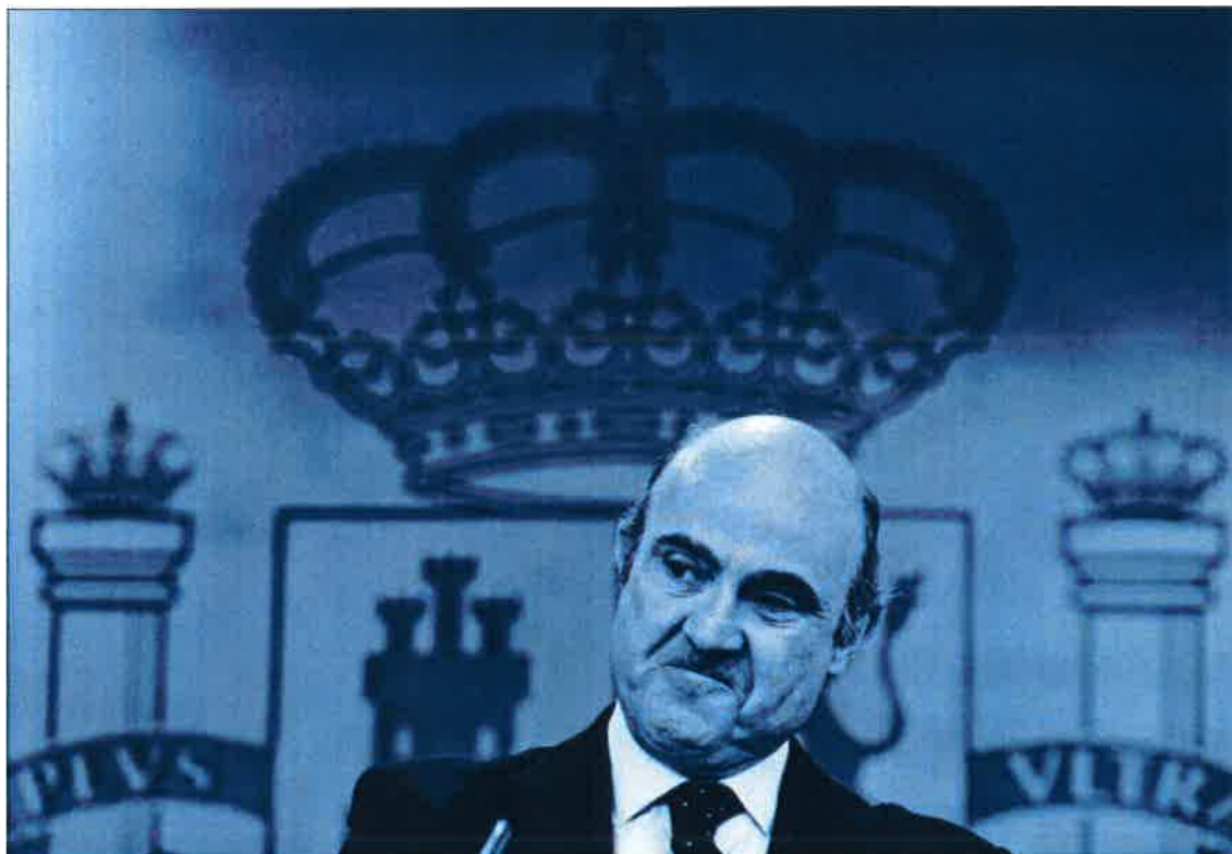
El ministro de Economía, Luis de Guindos, tras un Consejo de Ministros. BERNARDO DÍAZ

También el servicio de estudios del BBVA insistió el pasado viernes en su revisión al alza del crecimiento del PIB del 2,7% al 3% este año que «se soporta en la evolución de las exportaciones, y la mayor actividad en la construcción