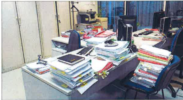
Una mesa llena de papeles en uno de los juzgados de Ourense.

Ahora, la administración autonómica, encargada de dotar los medios para la justicia, también emplaza al Gobierno central. "Actualmente a Xunta sigue esperando que el Ministerio de Xustiza apruebe o Decreto para poder poner en marcha a las cinco unidades judiciales comprometidas para este año. Galicia siempre solicitó nuevas unidades judiciales, e seguirá solicitando, haciendo un importante esfuerzo orzamentario para a súa posta en marcha, e sempre coa premissa de que unha xustiza mellor dotada sempre é máis eficaz, o que redundará nun mellor servizo aos cidadáns galegos", responde a este diario la consellería de Presidencia, Ad-