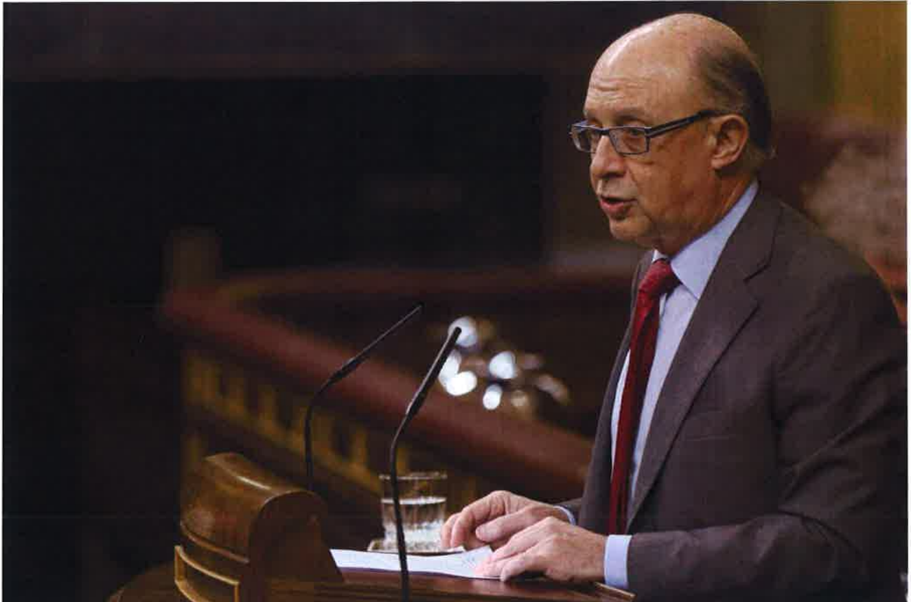
El ministro de Hacienda, Cristóbal Montoro, en el Congreso de los Diputados.

Un principio de acuerdo entre el PSOE y los ministros de Hacienda y Justicia, Cristóbal Montoro y Rafael Catalá, respectivamente, desactivará, o al menos interrumpirá, la intención del Consejo General de la Abogacía de convocar una huelga de los abogados del Turno de Oficio. La aplicación desde enero del Ministerio de Hacienda del 21% del IVA a este servicio puso en pie de guerra a este colectivo, de más de 35.000 profesionales, junto a los procuradores . El Grupo Socialista presentó una tanda de iniciativas en el Parlamento para parar esta nueva legislación que ayer el gobierno se comprometió a modificar. Las conversaciones las ha llevado el portavoz de Hacienda, Pedro Saura.