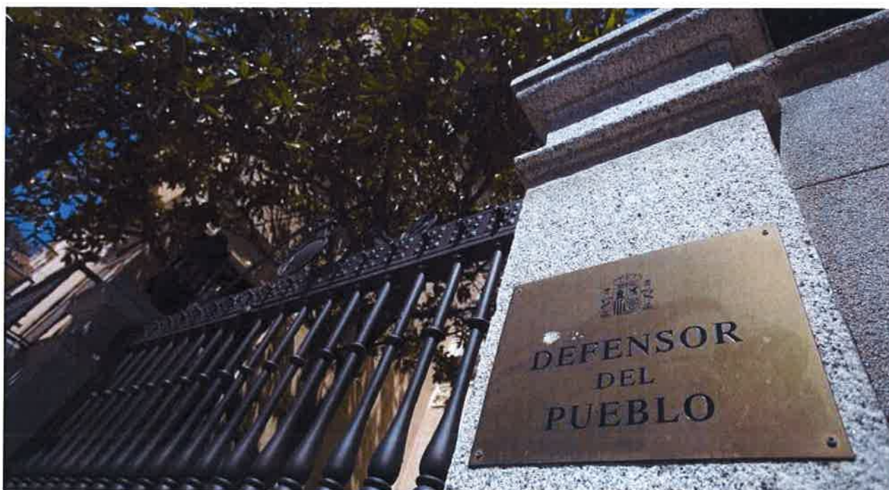
Sede del Defensor del Pueblo, en Madrid. eE

Las quejas presentadas ante el Defensor del Pueblo por dilaciones indebidas en los procedimientos judiciales registró un "notable" descenso el año pasado. En total, según la Memoria Anual correspondiente a 2016, la institución recibió 141 quejas, frente a las 176 de 2015. Por jurisdicciones, 79 correspondieron a la civil, 34 a la penal, 11 a la contencioso-administrativa y cinco a la mercantil.