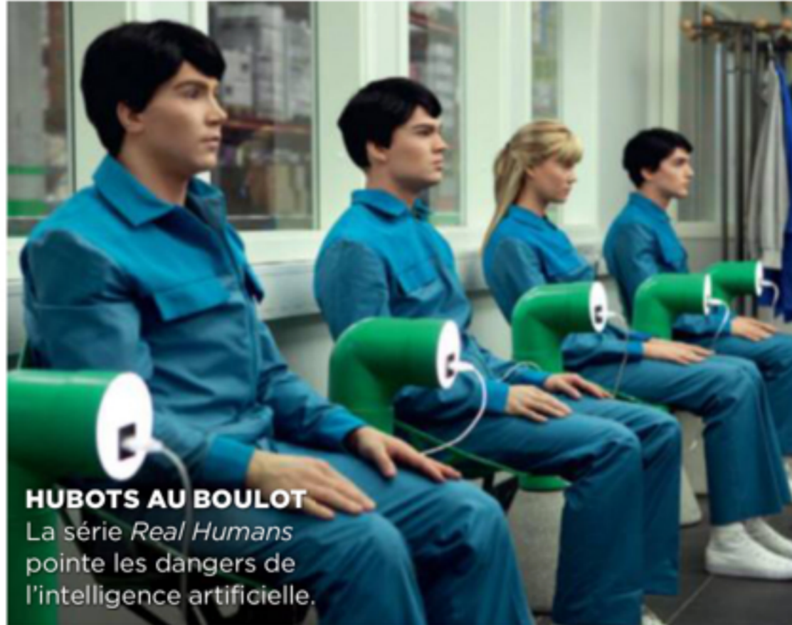
HUBOTS AU BOULOT La série Real Humans pointe les dangers de l'intelligence artificielle.

La faiblesse de notre époque tient à la tendance qu'ont nos dirigeants – et nombre d'artistes – à diffuser la crainte du lendemain. Regardons du côté des séries télé. Ce qui y est dit de l'avenir du travail est symptomatique. Dans Real Humans , les robots nous envahissent ; dans Trepalium , les hommes n'ont plus de job... Tous ces scénarios se révèlent encore trop englués dans les peurs. Où se trouve le visionnaire qui imaginera notre vie de demain, comme le fit Jules Verne en son temps