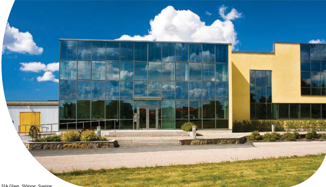
SIA Glass, Slöinge, Sverige. Pilkington Spandrel Glass Coated Pilkington Suncool ™ 50/25

Såvel enkeltglass som isolerruter kan brukes som fasadeglass.