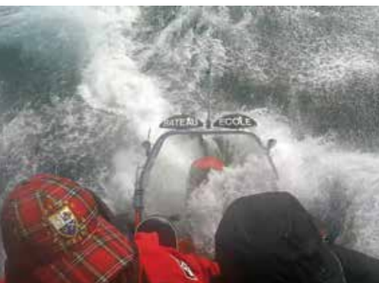
La base, c'est d'appréhender la vague pour la maîtriser.