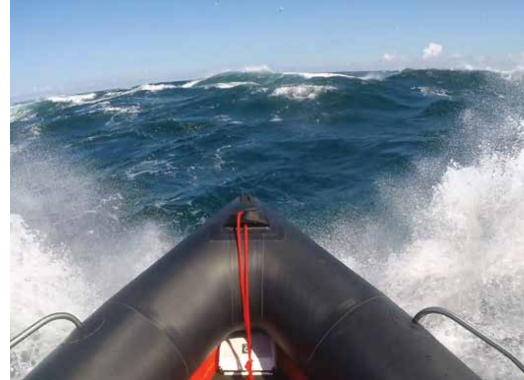
Face à la vague, à la barre d'un semi-rigide de 5,85 m, la formation est aussi une belle leçon d'humilité...