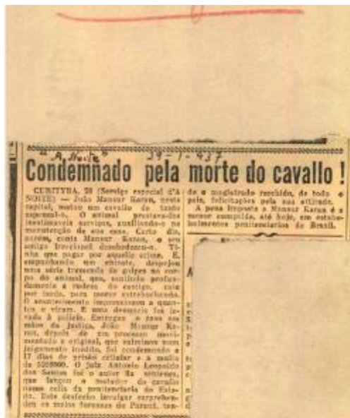
Fig. 7. Documento anexo ao requerimento de 2 de março de 1937 66

Mestre e Especialista em Direito Agroambiental Especialista em Inteligência de Estado Advogado e Professor