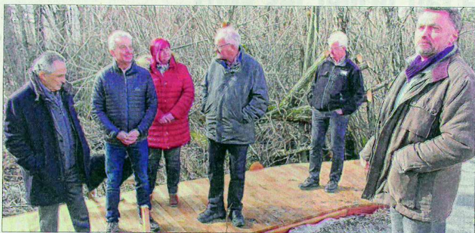
Hier, les élus locaux et membres du Smadesep procédaient à une visite de chantier.

Ils ont présenté les oiseaux visibles au Liou