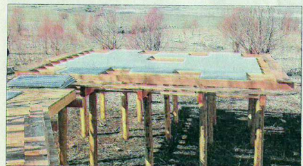
Des grilles ont été installées pour faciliter l'observation.

« Le seul lieu de reproduction piscicole du lac »