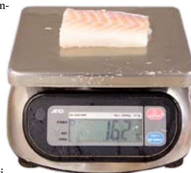
Nýja vatnsskurðarvélin sker af mikilli nákvæmni, svo ekki skeikar meira en 10 grömmum.