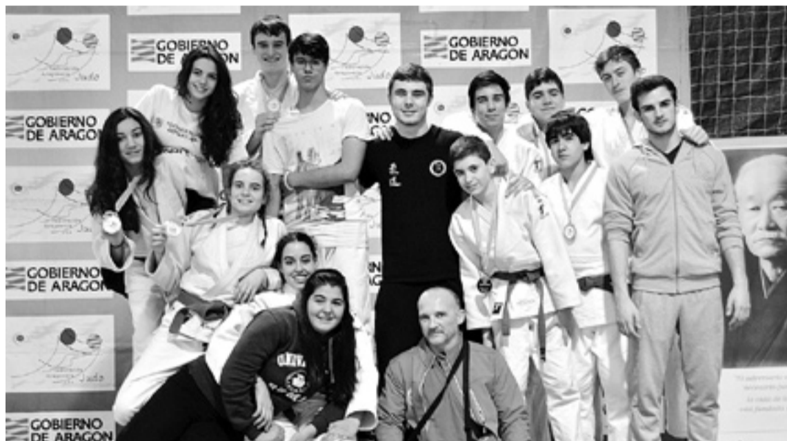
Representación cadete del club Ibón de Huesca.