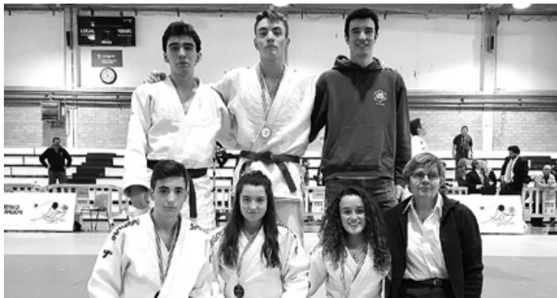
Judocas cadetes de la Escuela Samurai. S.E.